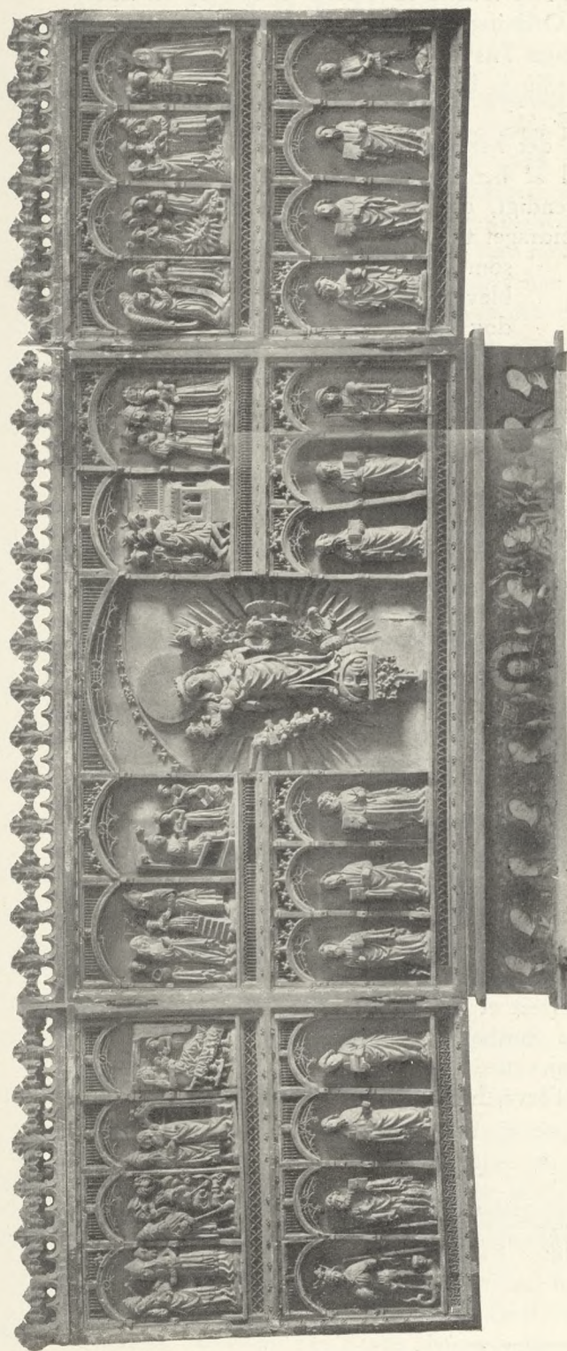
Boeslunde gamle, gotiske Altertavle (c. 1450).

I Midten Maria med Jesusbarnet, staaende paa Halv- maanen omgivet af spillende Engle, i de øverste Felter Episoder af Marias Liv, Jesu Fødsel og Jesu Omskæring, i de nederste Felter Sct. Olav, de tolv Apostle og