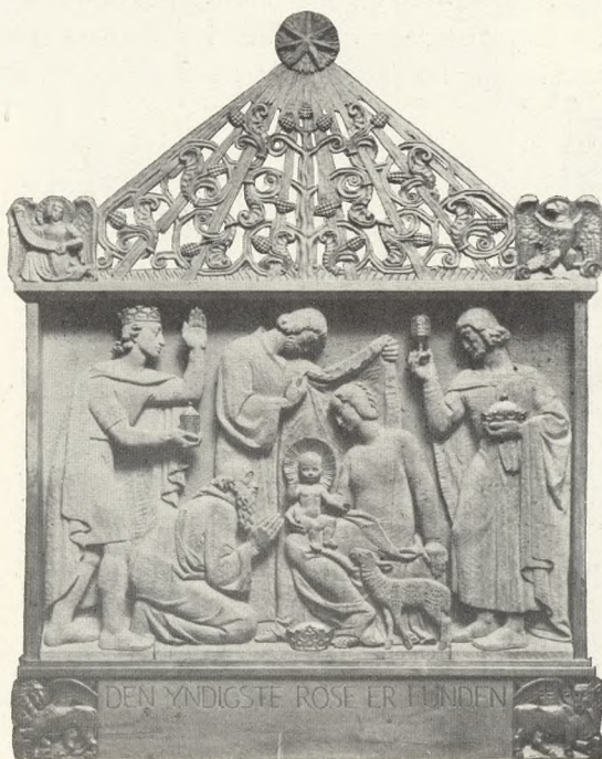
Foraarsudstillingen paa Charlottenborg: Billedhugger Axel Poulsen: Altertavle skaaret i Egetræ.

som denne Altertavle, selv om den er blevet lidt medtaget af Tidens Tand, vil dog altid være smukkere end en ny moderne — og der kan ikke vises Omhu nok for at bevare de gamle Kirkeklenodier og bevare dem for Kirkerne, selv om der maa ofres nogle Penge paa Vedligeholdelsen.