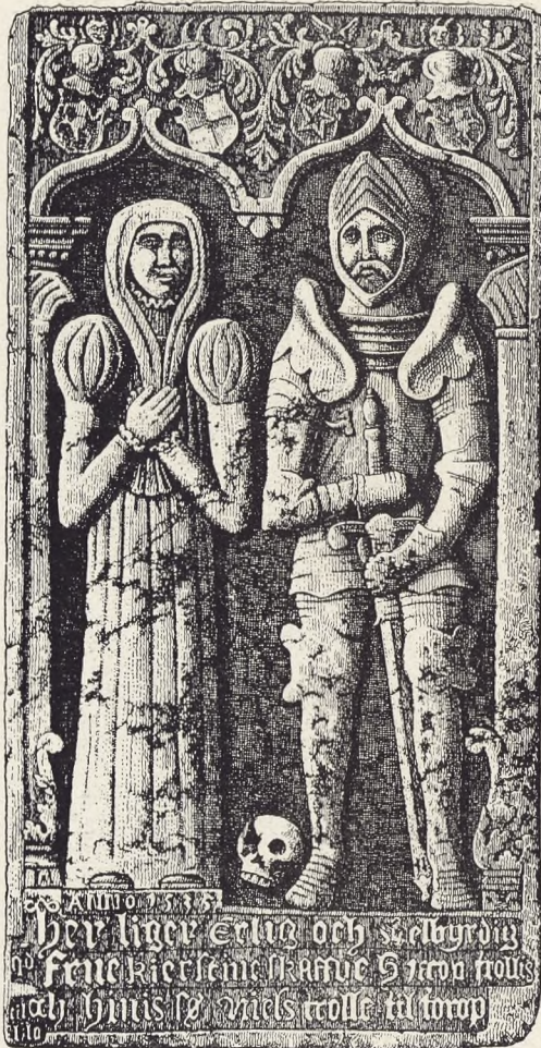
Gravsten fra 1500-Tallet

mange Gravmæler i deres Form er afledet af Sarkofagen eller maaske snarere af Boligen.