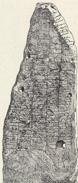
Runesten fra Tryggevælde

Begravelsen foregik derfor hurtigt efter Døden, som oftest inden 24 Timers Forløb. Ligkister kendte man ikke, men Liget blev lagt paa en Baare og blev af den Afdødes Standsfæller paa Skuldrene baaret til Graven, enten denne var den Døde beredt inde i selve Kirken eller paa Kirkegaarden uden om.