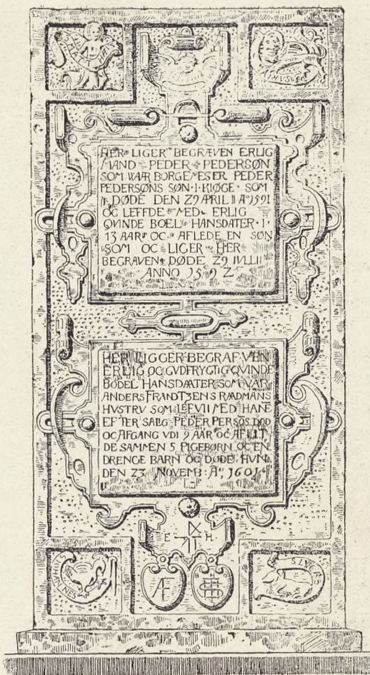
Gravsten fra 1600-Tallet