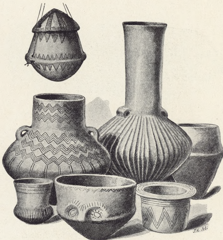
Lerurner fra Broncealderen