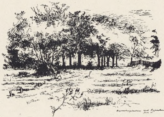
Fig. 166. Ib Andersen: Begravelsespladsen ved Ryparken, Juli 45.

Da man ved Opgravningen konstaterede, at Jorden i den østlige Side var meget sur og vandfyldt, tilraadedes det at lade Arealet dræne inden Begravelsen. Dette Arbejde udførtes af Ingeniørfirmaet Rasmussen & Schiøtz , og da Arealet ligger