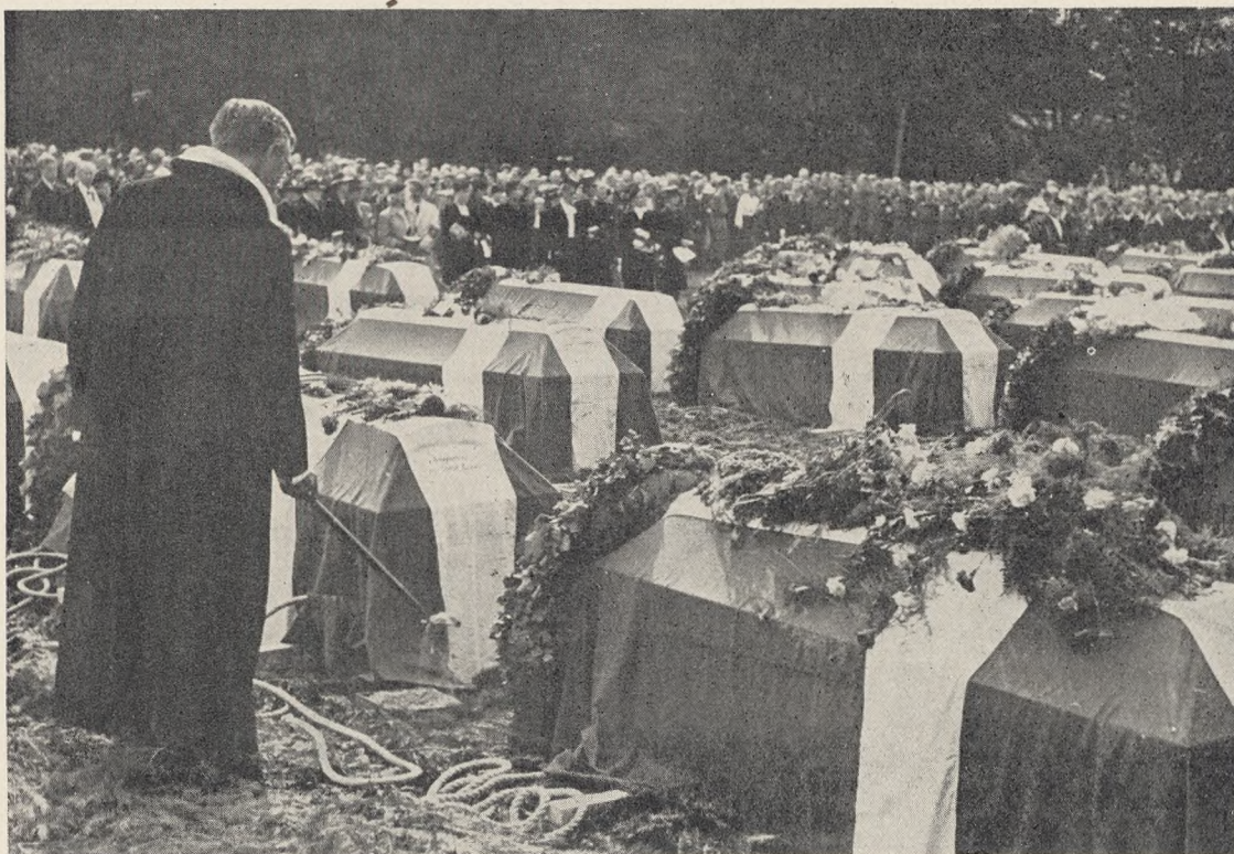
Fig. 170. En af de 8 medvirkende Præster foretager Jordpaakastelsen, inden Kisten sænkes af Frihedskæmpere.