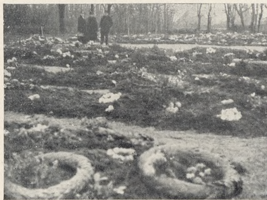
Fig. 171. Patriotgravene er dækket af Gran og Kranse. Novemberstemning. Foto: J. Th.

Umiddelbart efter Højtideligheden jordes Gravene, og over hver Kiste opklappedes en Gravhøj, der blev pyntet med det Væld af Blomster og Kranse, som i Dagens Anledning var sendt ud til Ryvangen.