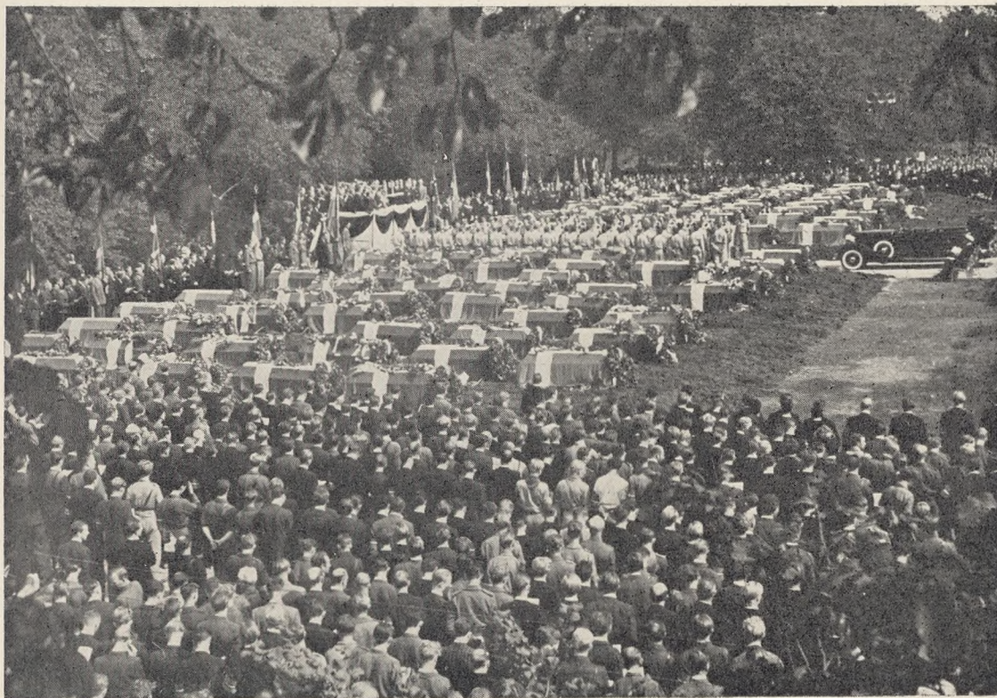
Fig. 169. Kister og Urner er anbragt; Kongeparret i den aabne Vogn. Frihedskæmpere staar Æresvagt.