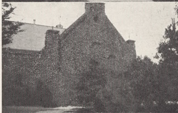
Partier fra Lund Kirkegaard.