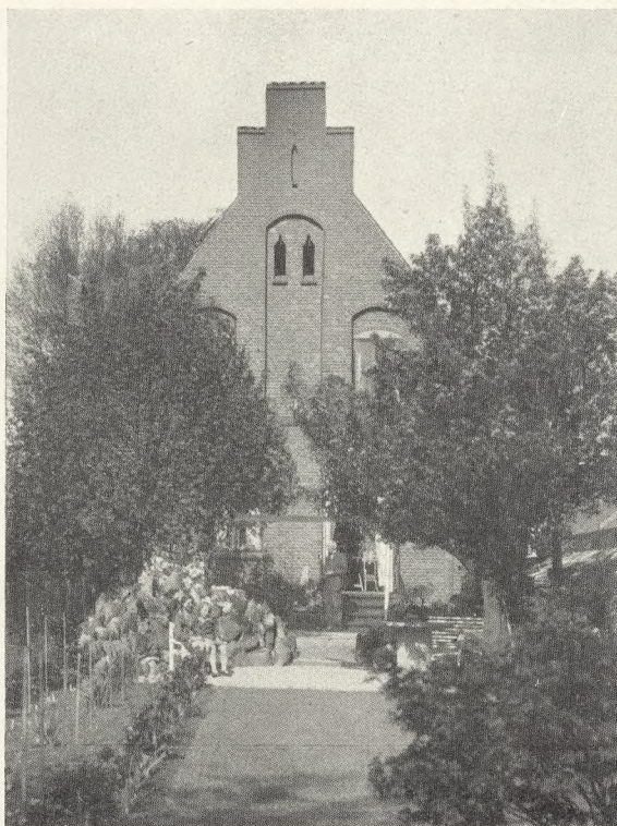
Ved Graverboligen paa Graabrødre Kirkegaard. Foto 1927.

„Op til dette fortidsskumle Torv støder den gamle Graabrødre Kirkegaard, der fra den tidlige Middelalder har omgivet det Tiggermunkekloster, som ganske vist forlængst er sunket i Grus, men hvis Aand alligevel stadig usynligt synes at svæve mellem de høje Træers Kroner og over de stille Grave.