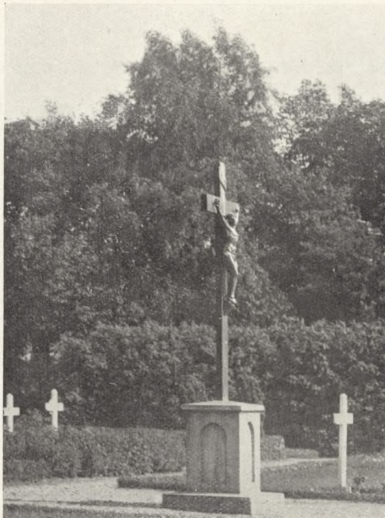
Parti fra den katolske Afdeling paa den nye Kirkegaard. Foto 1927.

En Tid lang benyttedes Sct. Ibs Kirkegaard en hel Del af Borgerne paa Sct. Jørgensbjerg, senere er dette hørt op, og man er paa Sct. Jørgensbjerg ved at indrette en ny Kirkegaard efter Tegning af Arkitekt H. Schmidt . Samtidig er Sct. Jørgensbjergene ogsaa begyndt at søge til Roskilde nye Kirkegaard, og skønt de paagældende Beboere er udenbys, har man ikke sat sig herimod. Resultatet er da bleven, at den nye Kirkegaard er ved at blive for lille, og at man har maattet se sig om efter Jord til Udvidelse, hvilket formentlig vil kunne ske i umiddelbar Tilknytning til den eksisterende Kirkegaard. Et Udvalg arbejder for Tiden med denne Sag.