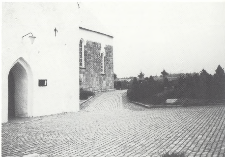
På Jetsmark kirkegård i Vendsyssel findes denne smukke gangbelægning.

men hele denne problematik er så omfattende, at pladsen her ikke tillader en fristende uddybning af emnet. Så herom i en senere artikel.