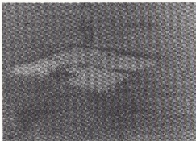
Otte sådanne sten er lagt i arealet, tegnet af Steen Høyer, de har to linier, den ene med retning mod kirketårnet, den anden mod nordstjernen.