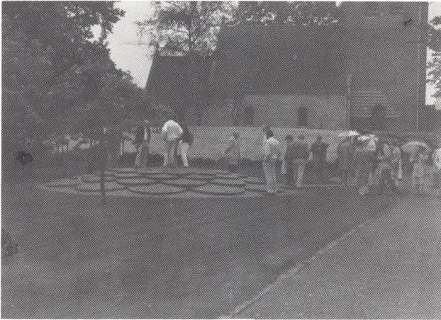
Askefællesgrav udformet af landskabsarkitekt Torben Michelsen.