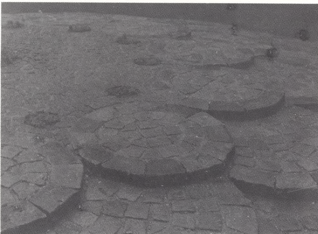
Detalje af askefællesgrav.