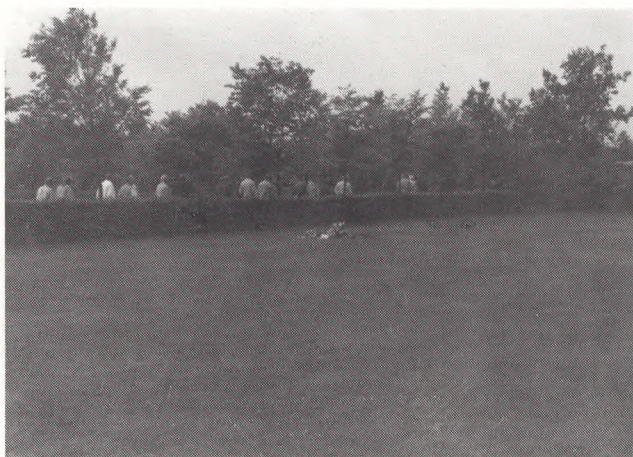
En af cirkelafskæringerne med fællesgrav.