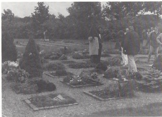
Urnegravsteder i cirkelafsnit mod syd. Planlagt med ensartet bunddække af vedbend, men det var mislykket.