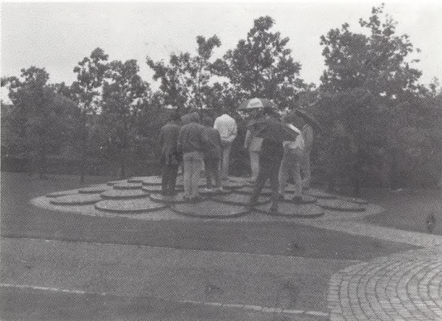
Askefællesgravens udform- ning er samtidig en skulptur.