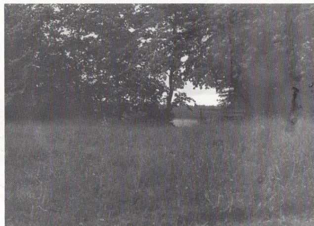
Imellem den gamle og den nye kirkegård ligger denne perle af natur med udsigt over Farum sø. - Tænk hvad man har tabt ved ikke at anvende dette areal; men det kan måske komme i fremtiden.