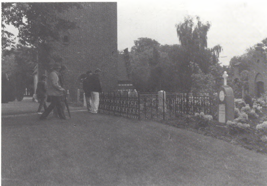
Monumenterne er de traditionelle, der kan findes næsten overalt på Sjælland.