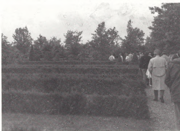
Gravgårdene er anlagt med enkeltrækker og ret smalle gange.