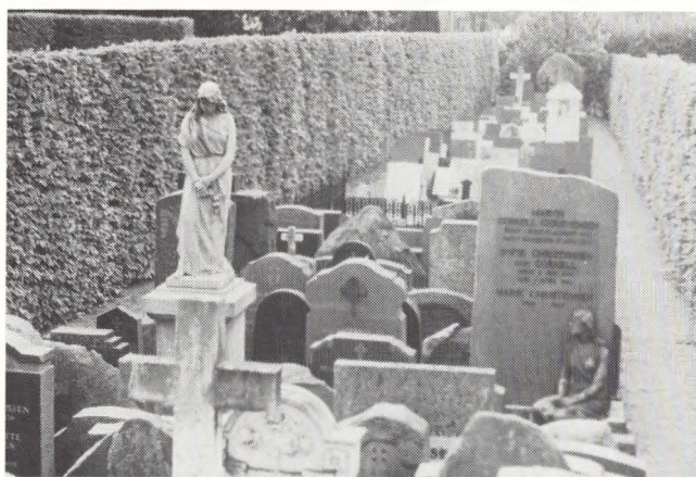
Fig. 13. Ikke alle gravminder er bevaringsværdige, men medens de venter på »historiens dom« opstilles de pænt i lapidarium til registrering - og endelig placering. Sorø Nye kirkegård.