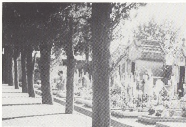
Fig. 9. Sydfransk kirkegård, hvor gravstederne »gror op« til mausolæum. Carcassonne, Frankrig.