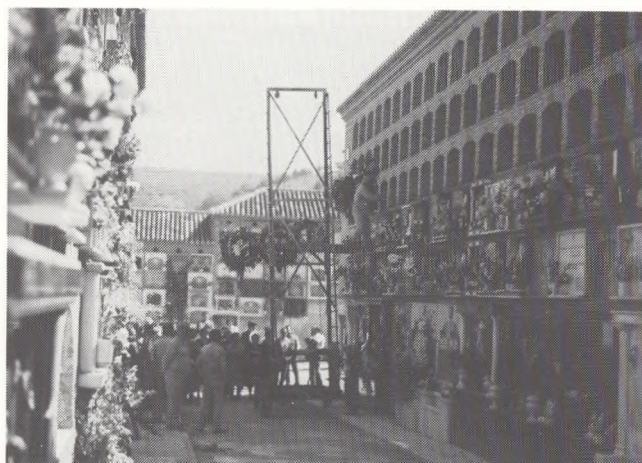
Fig. 8. Kisten hejses på plads, mens ligfølget synger afskedssalmer. Granada, Spanien.