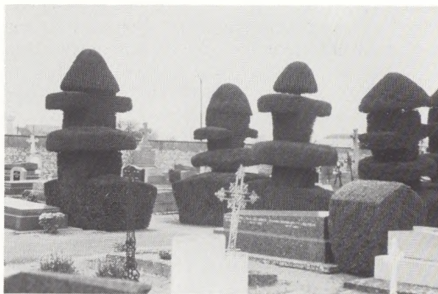
Fig. 7. Gravstelen træder helt ud af sin oprindelige funktion og bliver symbol for begrebet kirke(gård). Tours, Frankrig.