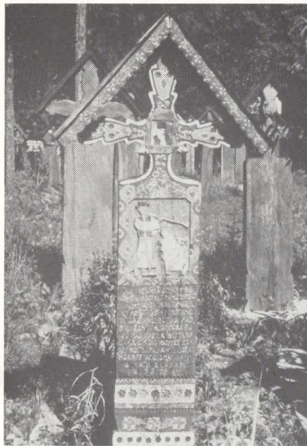
Fig. 2. Gravmæle over en hyrde. Sapinta, Rumænien.

I dag kan vi overalt i middelhavslandene gå igennem hele lange bygader med familiegrave bestående af mindre kasser; tumba-gravsteder. Det er kældre med plads til 2 x 3 kister i etager. På det - som regel flade tag - een til to meter