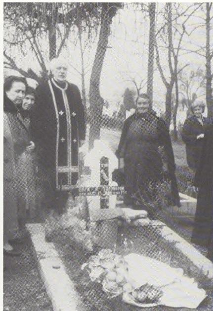
Fig. 3. Gravsengen danner grundlaget for familieidentiteten. Gravmåltidet. Plovdivn, Bulgarien.