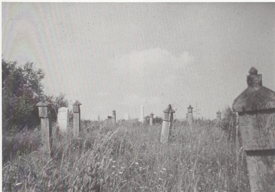
Fig. 1. Gravmindets urform: en stèle eller »varde« som vejviser.

De tragtbægerformede jættestuer havde deres største udbredelse i Sydsverige, Danmark, Nordtyskland, Belgien, Vestfrankrig, Spanien og Portugal - for 3 til 5 tusinde år siden.