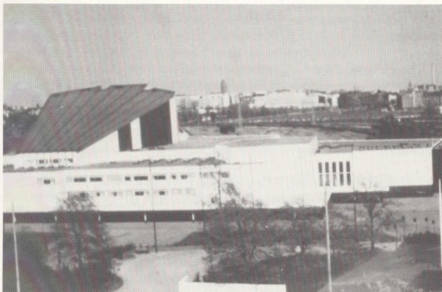
Helsingfors, Finlandiahus.