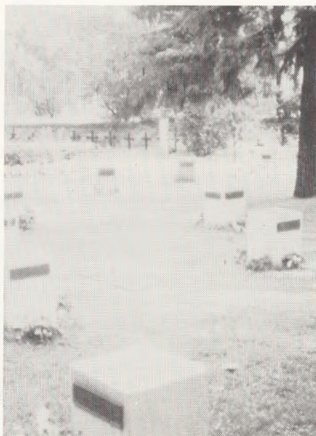
Tammerfors, Kalavankangas Kirkegård, Urnegrave.