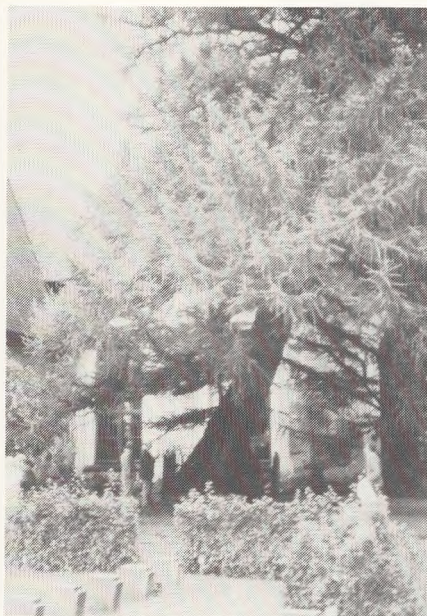
Hauho gamle kirkegård. Stor lærk på lille grav.