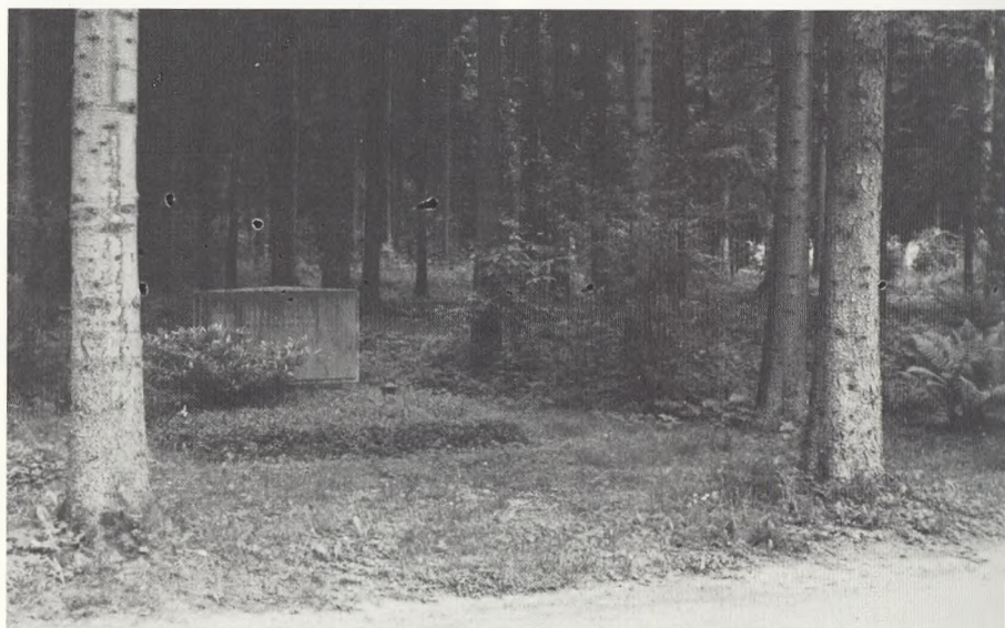
München, Waldfriedhof (fig. 6).

Der er stadig langt til G. N. Brandts opløste gravsted.