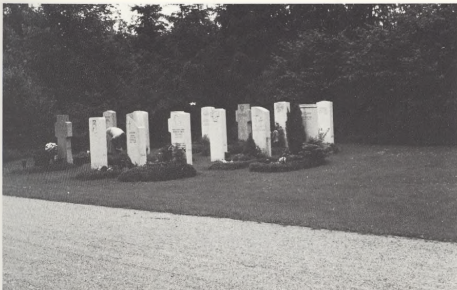
München, Waldfriedhof (fig. 3).

i sin blotlagte orden og stabilitet, og det er vanskeligt at forestille sig, at det kan blive anderledes. Man bliver bestyrket i denne tanke, når man fortsætter videre til kapellet på nye del (fig. 4). Bygningens vælde står i voldsom kontrast til den meningsløse sammenplantning i forgrunden. De to sidste billeder (fig. 5 og 6) viser en langt bedre indpasning i skovmiljøet end i figur 1, og mellem 5 og 6 er der