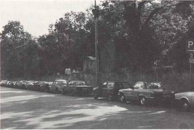
München, Südfriedhof. Indgangen ved Thalkircher Strasse.