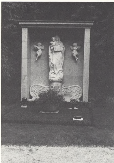
München, Waldfriedhof (fig. 1).

Først ses et gravsted fra 1982 på den gamle del (fig. 1), som i udformning og gartnerisk plejeniveau står i skærende kontrast til beliggenheden på en skovkirkegård. En lille afdeling på gamle del (fig. 2) skal ses med en tilsvarende fra nye del til sammenligning. Træernes tyngde, afdelingens placering med kortsiden mod en større vej, det moderat udnyttede areal, den forskudte sti, alt er med til at give en rimelig helhed. Den nye afdeling rummer ingen forsonende elementer