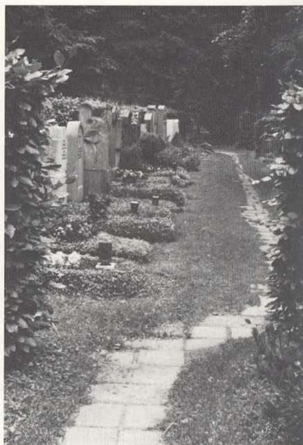
München, Waldfriedhof (fig. 2).