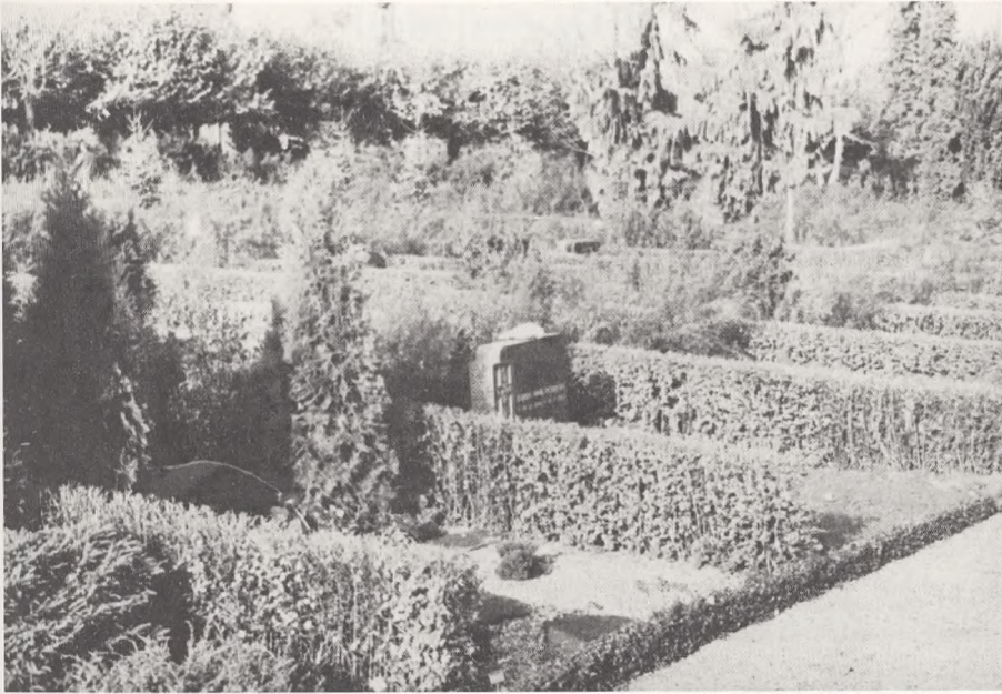
Fig. 6. Afdeling med hække af Ribes alpinum og som fælles baghæk Spiræa van houtii . (Foto: Henning Hansen).

De viste eksempler er led i en langtidsplanlægning, hvor vi løbende forsøger at give gravstedsbeplantningen bedre vækstmuligheder.