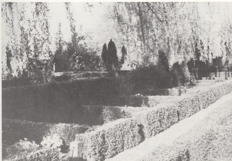
Fig. 1 Gamle thujahække som snart skal udskiftes..