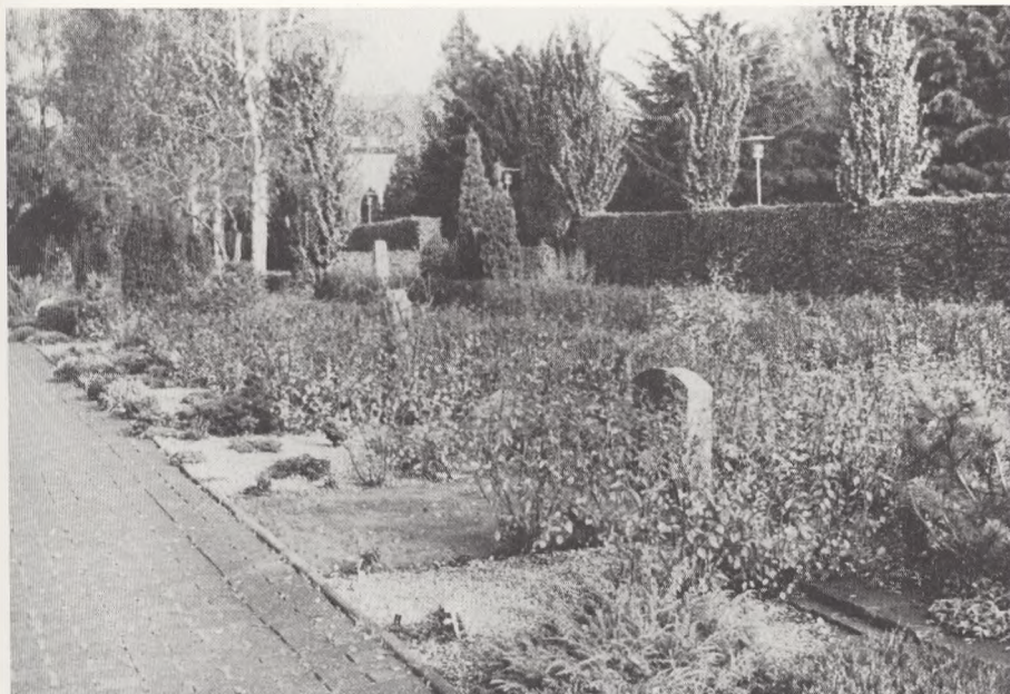
Fig. 3. Efter omlægning, mellemhække af Cotoneaster acutifolia m.v..