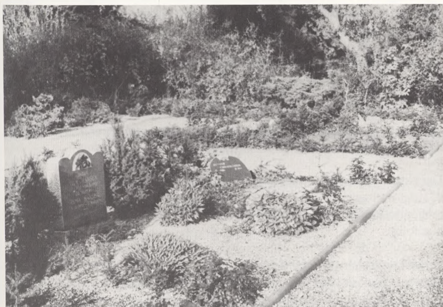
Fig. 4. Efter omlægning, mellemhække af Taxus baccata m.v.