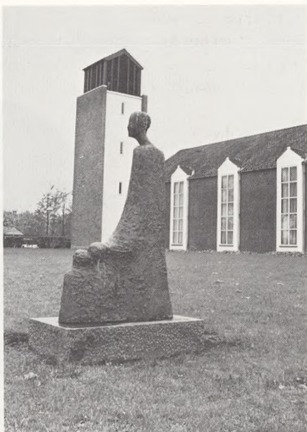
»Det lange menneske«, Mørkhøj kirke, af Hanne Varming.