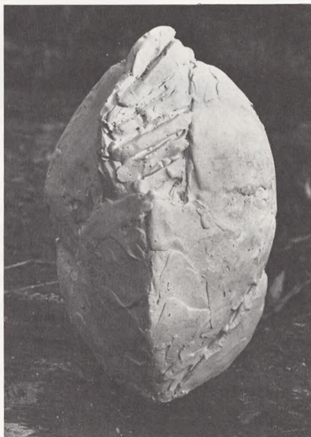
»Frøet«, udkast til granitskulptur til fællesgrav af Erik Varming.