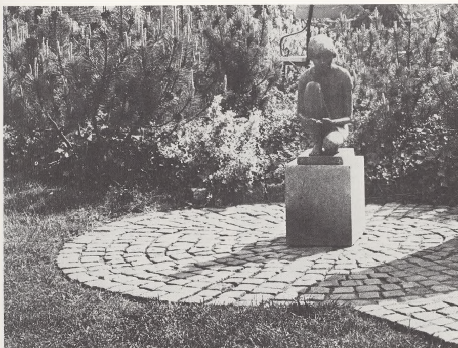
»Knælende pige«, Fællesgraven, Arby kirkegård, af Hanne Varming.