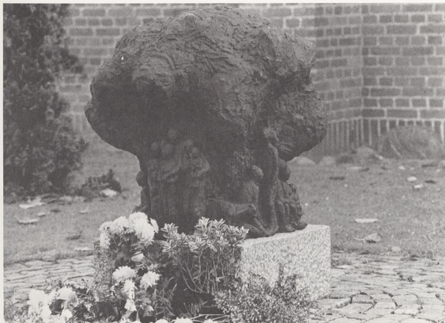
»Livets træ«, Fællesgraven, Skt. Jørgensbjerg kirkegård, Roskilde, af Erik Varming.