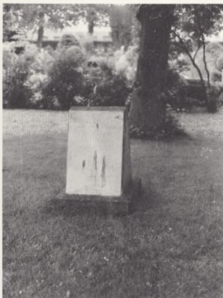
Ærøskøbing kirkegård. Ærøs nære tilknytning til Sønderjylland ses også af denne dobbelt sten, der er over to toldere, der druknede på rejse til Ærø fra Sønderjylland.