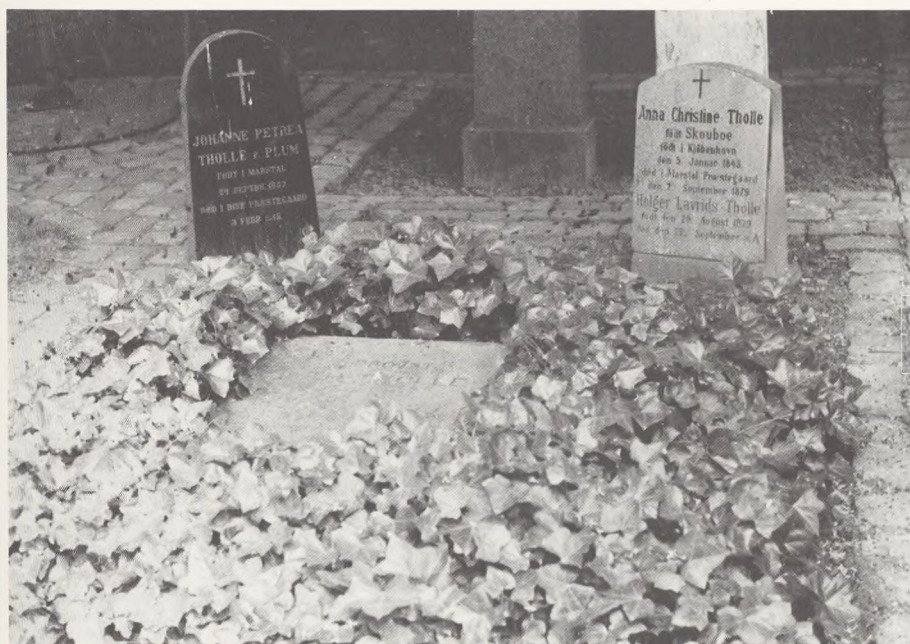
Marstal gamle kirkegård, provst Tholles gravsted, (havearkitekt Johs. Tholles fader).