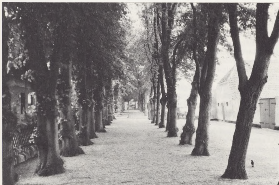
Ærøskøbing, alleen mellem byen og kirkegården, men bemærk det dårligt placerede nye træ!