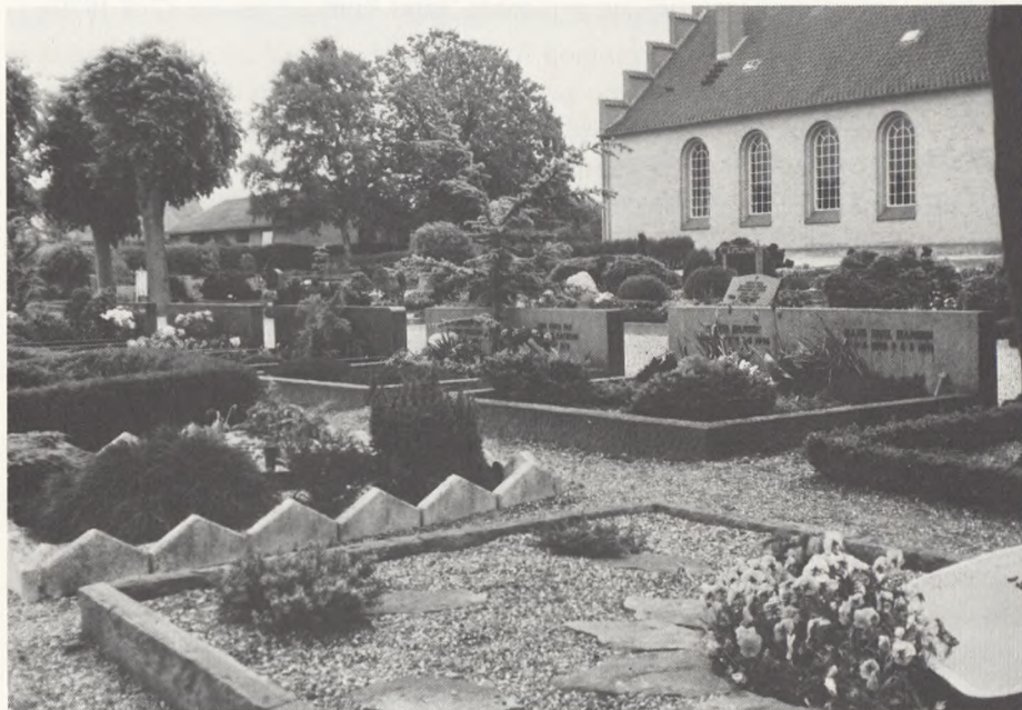
Marstal nye kirkegård.