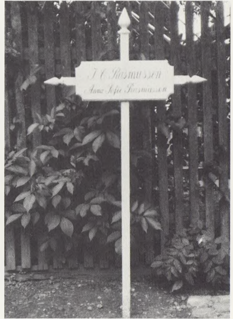
Marstal gamle kirkegård. En gammel monumentskik, gravstokken i forskellige udformninger også som kors med inskriptionsplade. Alle er de smukt drejearbejde og velholdte med maling.