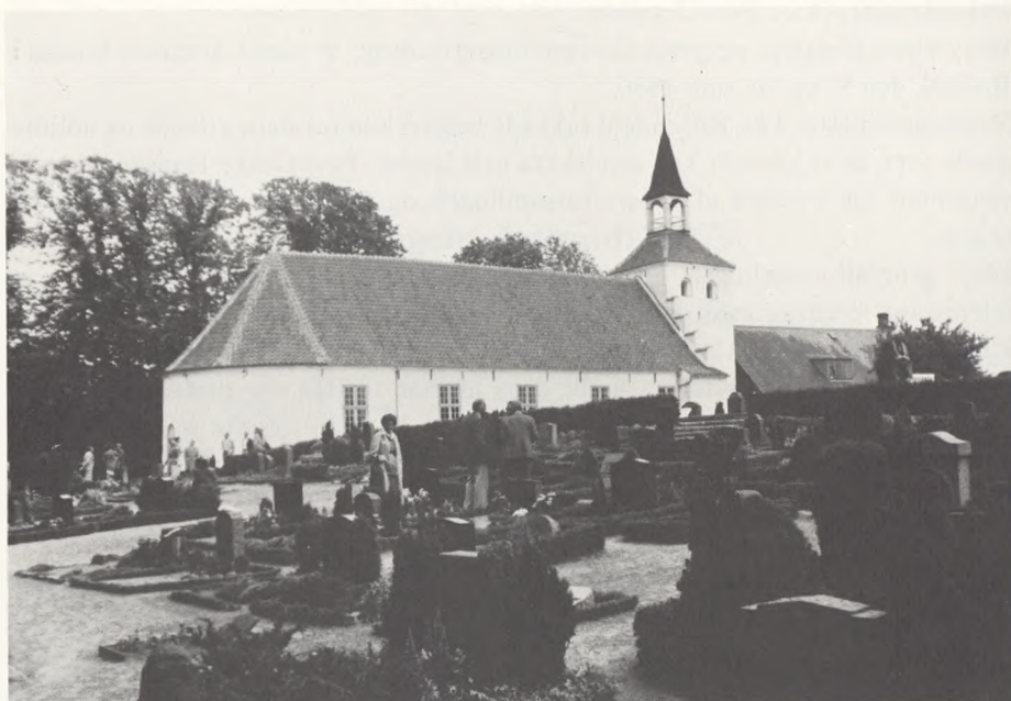
Søby kirke og kirkegård.