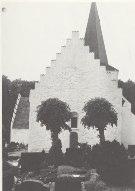
Brejninge kirke og kirkegård.