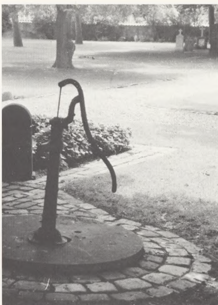
Marstal gamle kirkegård.