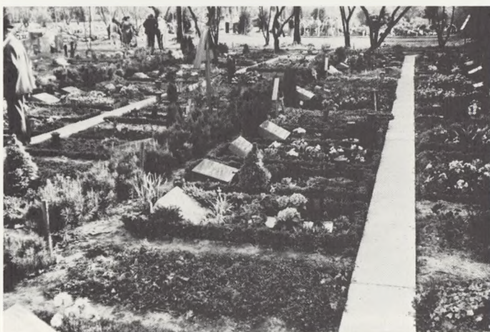
Bonn, afdelingen er reguleret og de fleste gravsteder er anlagt.