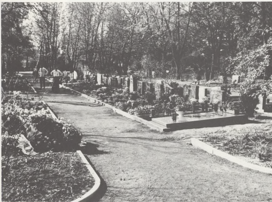
Bonn, individuelle gravsteder.

Herfra gik det videre til Bonn's største kirkegård beliggende i den nordlige bydel. Her findes hovedsagelig to former gravsteder, de individuelle og rækkegrave. Ved de individuelle kan man selv vælge, hvilket gravsted man ønsker, men de grave som ligger »pænest«, ved store gange eller under et pænt træ, er dyre i anskaffelse, og det selvom de har samme størrelse og måske endda støder op mod hinanden. Disse former for gravsteder er alle, med få undtagelser, indrammet med slebne granit- eller marmorrammesten. Der er ingen side eller baghække, så når man så