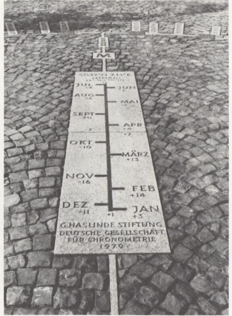
Solur, Bundesgartenschau Bonn. 1979)