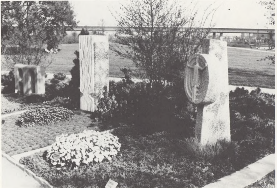
Familiegravsteder med konkurrencemonumenter, det t.v. er skabt af billedhuggeren Oswald Schneider, Siegburg.