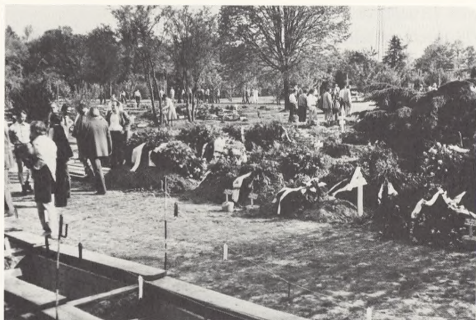
Bonn, nybegravede og endnu ikke benyttede, men færdiggravede grave.