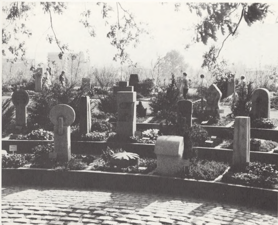
Bonn, Bundesgartenschau, urnegravsteder med konkurrencemonumenter.

Om eftermiddagen var vi på besøg på Bundesgartenschau, et storslået og flot anlæg