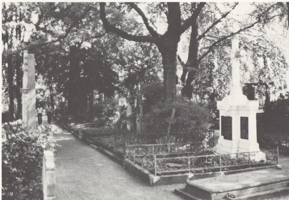
Stemmingsbillede fra Bonn's gamle kirkegård.

På de nye afdelinger udlægges gravstederne med 1,4 \times 2,8 m. Herved kan monumenterne og rammestenen, som forefindes på de fleste grave, blive stående