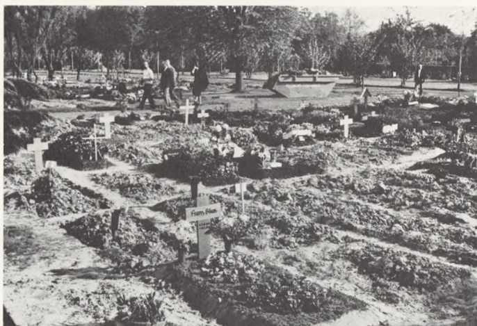
Bonn, lidt ældre, men endnu ikke anlagte gravsteder.