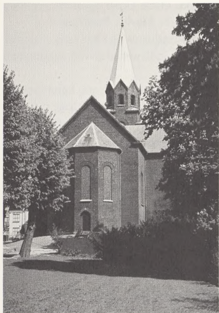
Skt. Nikolai kirke, Holbæk