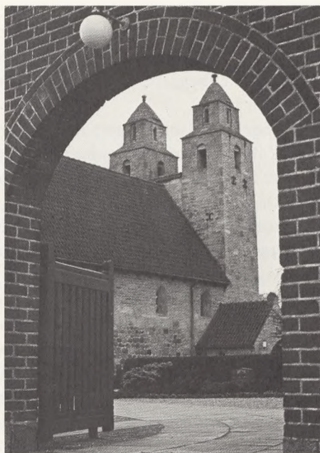
Tveje-Merløse kirke, Holbæk