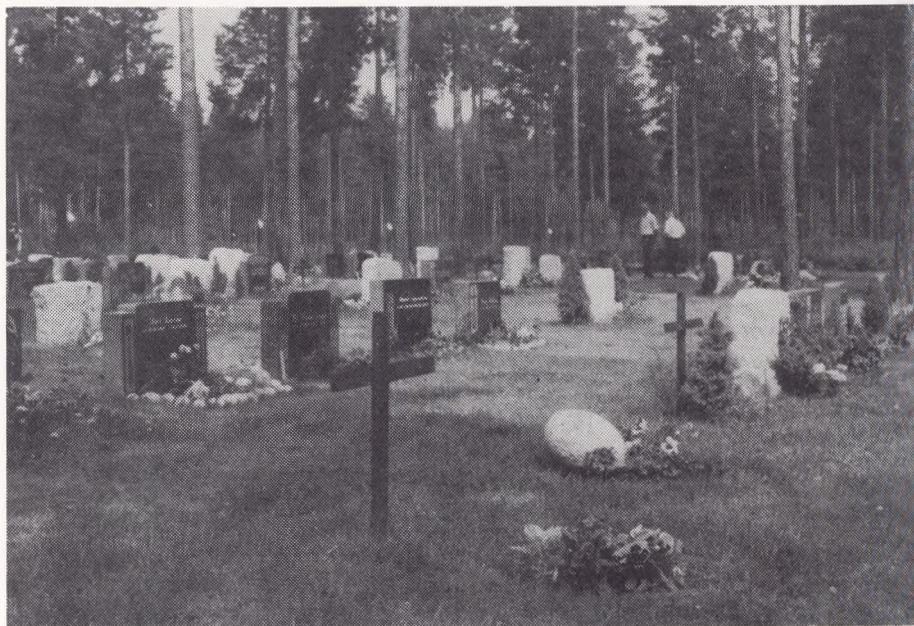
Kongsbergs nye skovkirkegård på Grumsrud

deltidsstilling eller i kombination med en anden kirkelig eller kommunal stilling. Den valgte kirkeverge får normalt ingen fast løn, men et mindre årligt honorar til