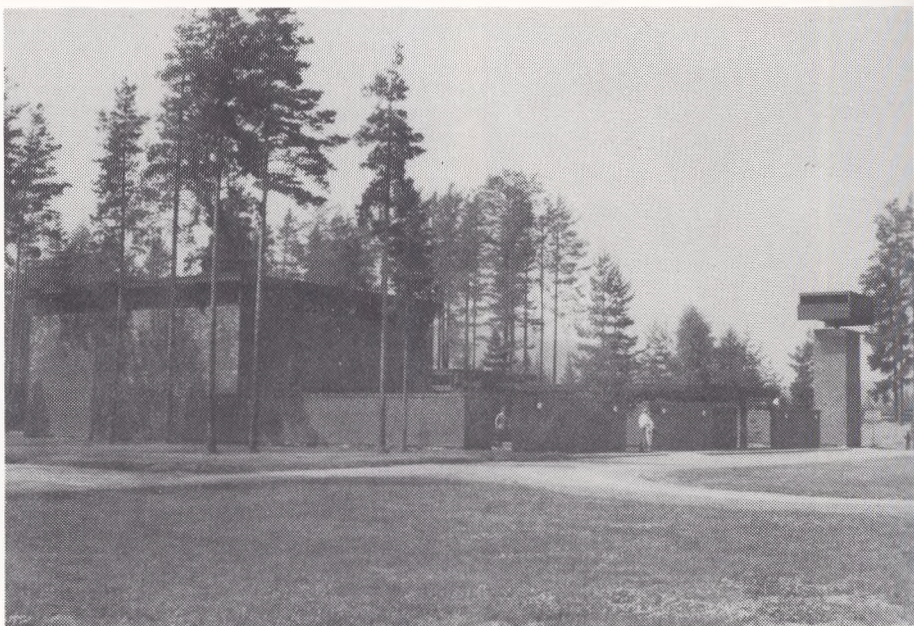
Kongsbergs nye krematorie på Grumsrud

deltidsstilling eller i kombination med en anden kirkelig eller kommunal stilling. Den valgte kirkeverge får normalt ingen fast løn, men et mindre årligt honorar til