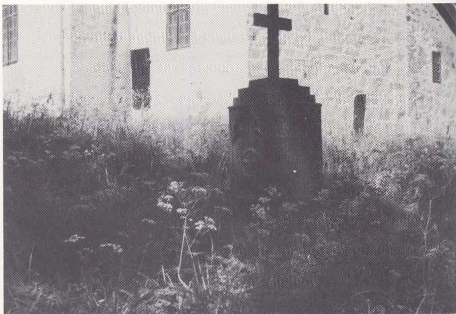
Gammelt dansk støbejernsmonument ved Fiskum gamle kirke

gennem blomsterdækkede enge, medens den lyse nordiske midsommeraften og fuldmånen konkurrerede om belysningen, for tilsidst at slutte ved denne gamle kirke omkranset af en græsklædt kirkegård skrånende ned mod en sølvglitrende sø. Landsmødet sluttede med besigtigelse af Kongsbergs nye kirkegård og krematorie og selvfølgelig besøg i sølvgruberne og Christian d. IV.s kirke i Kongsberg. Såvel i minerne som på byens gamle kirkegård havde man rig lejlighed til at foretage et historisk tilbageblik til danskertiden i Norge, idet man pietetsfuldt havde bevaret gravstenene over danske slægter.