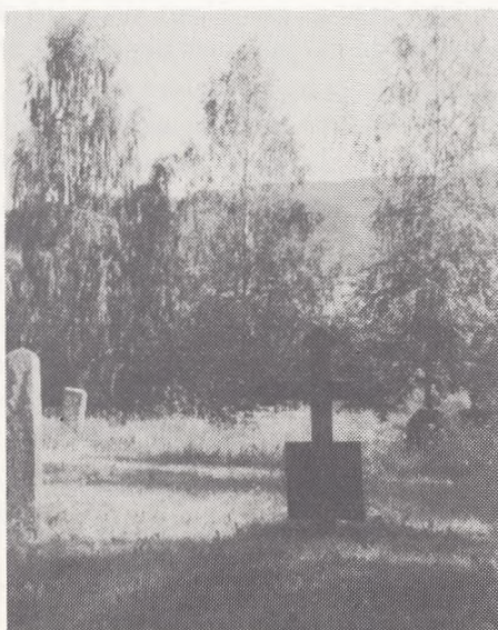
Fiskum gamle kirkegård.