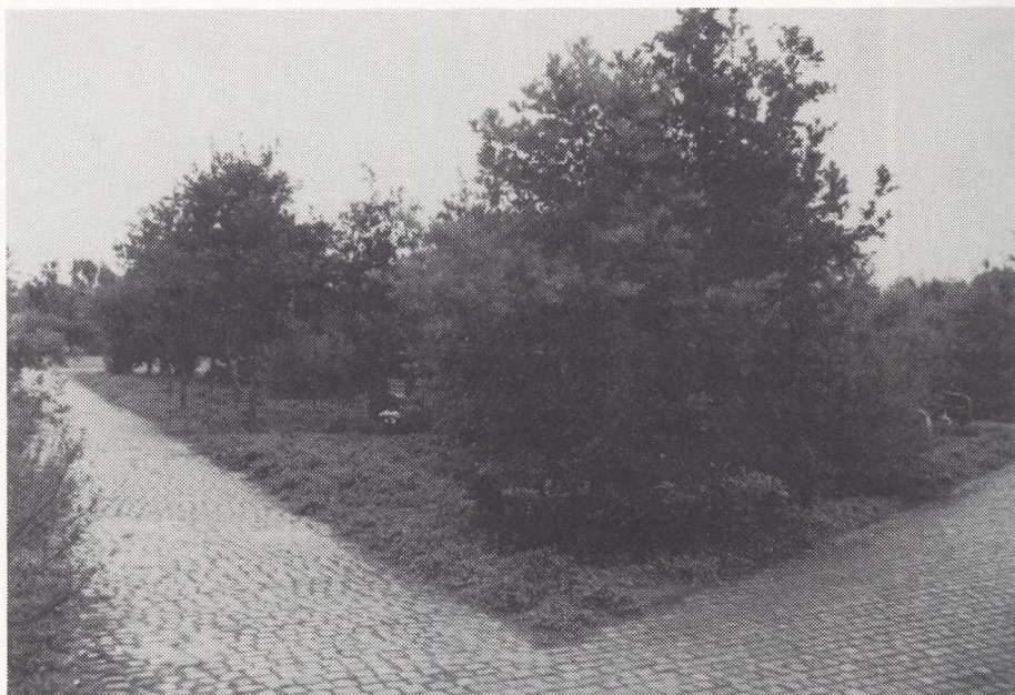
Skovplantningen 1978

Indenfor området kirkegårde er og bør der altid være plads, tid og råd til, at der i videst muligt udstrækning tages hensyn til det æstetiske og kulturelle og ikke blot