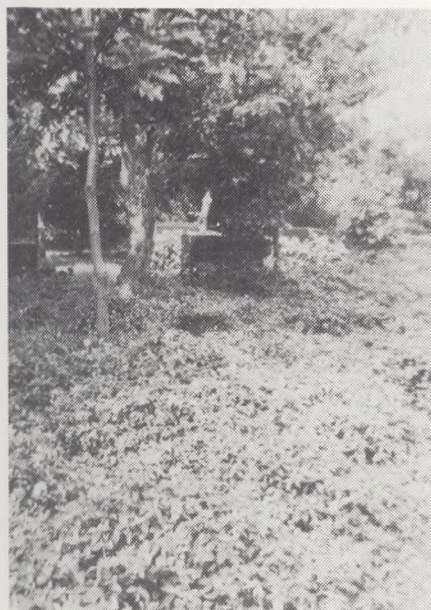
Fra Skovafdelingen 1978

Ideen med et sådant begravnings-anlæg er meget smukt og tillidsvækkende. Men til trods herfor, er der, ihvertfald her i landsdelen et meget stort og udbredt behov for