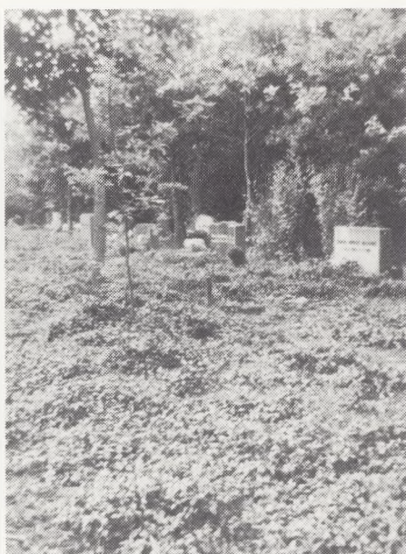
Fra Skovafdelingen 1978