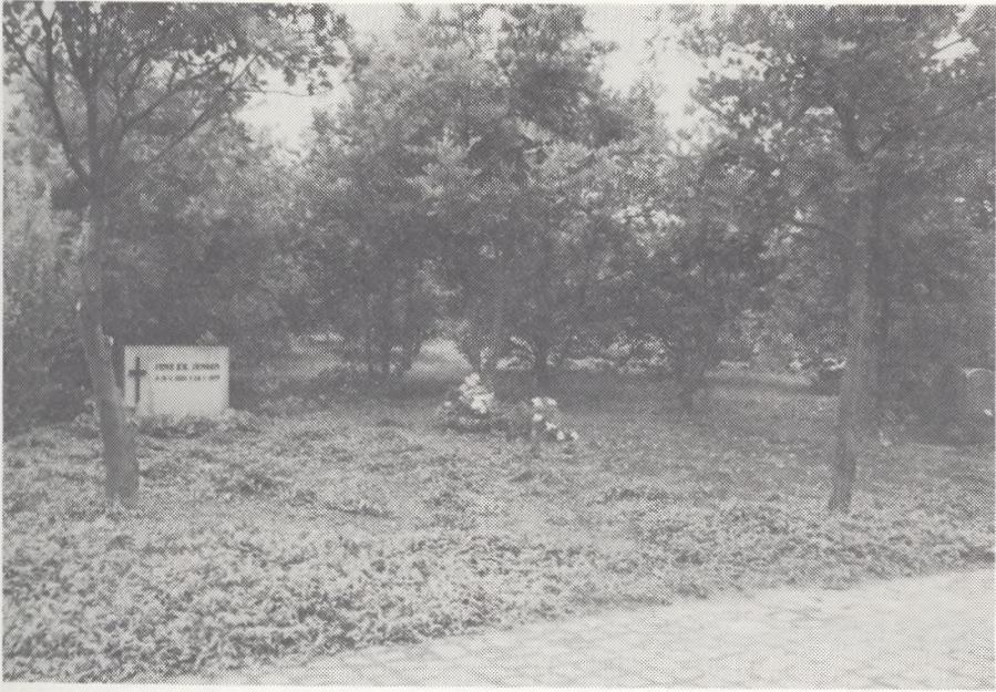
Gravsteder i skovområdet 1978