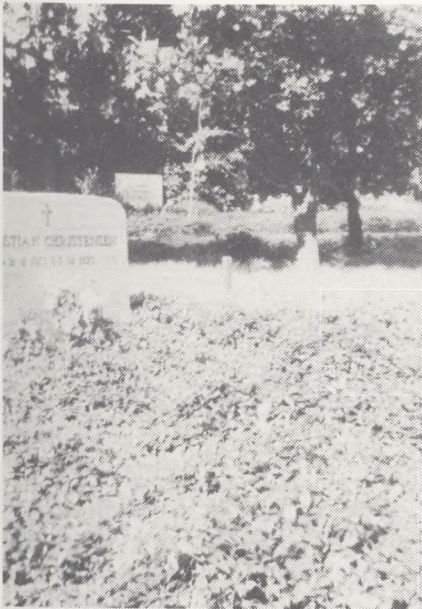
Gravsteder med godt bunddække i skovområdet 1978.