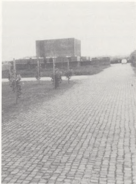
Kapellet, Nordre Kirkegård, Herning 1978