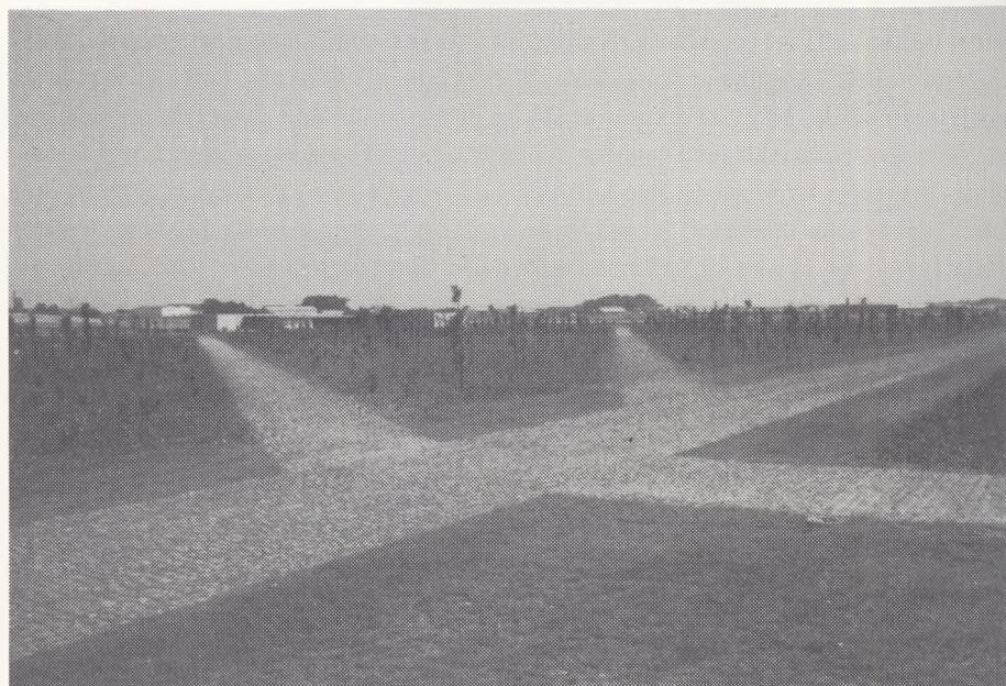
Et udsnit af skovbeplantningen før indvielsen 1969