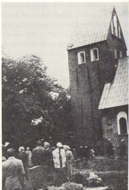
Hjerpsted kirke og kirkegård.