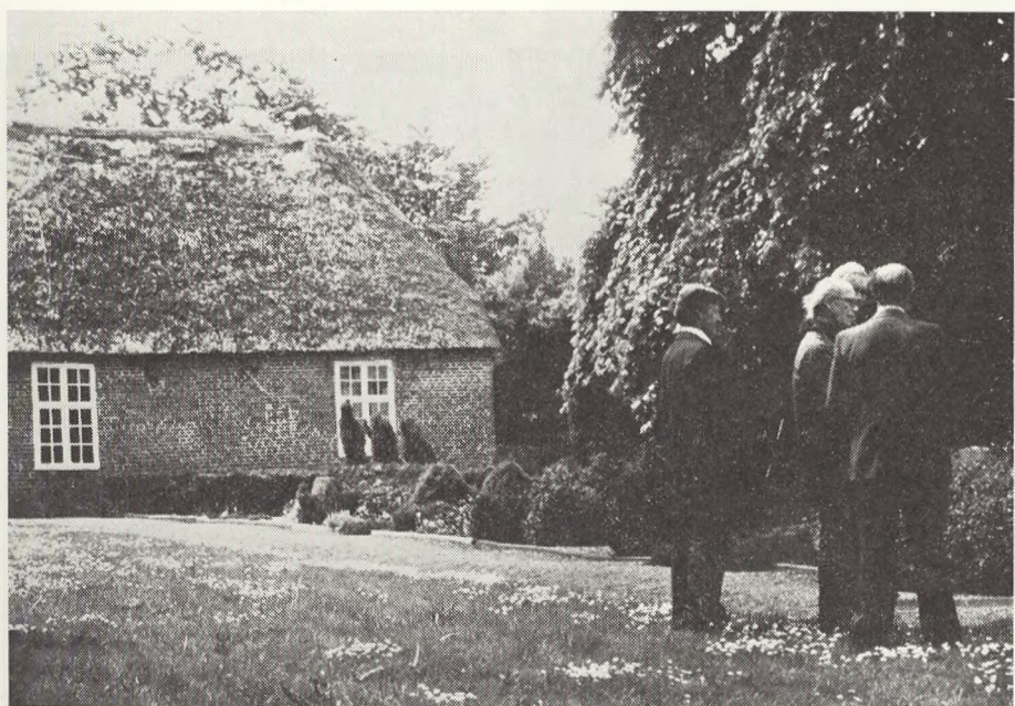
Ballum kirkegård.