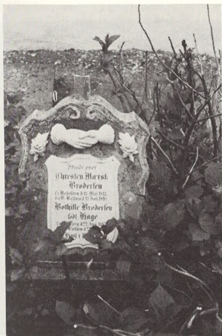
Ballum kirkegård.