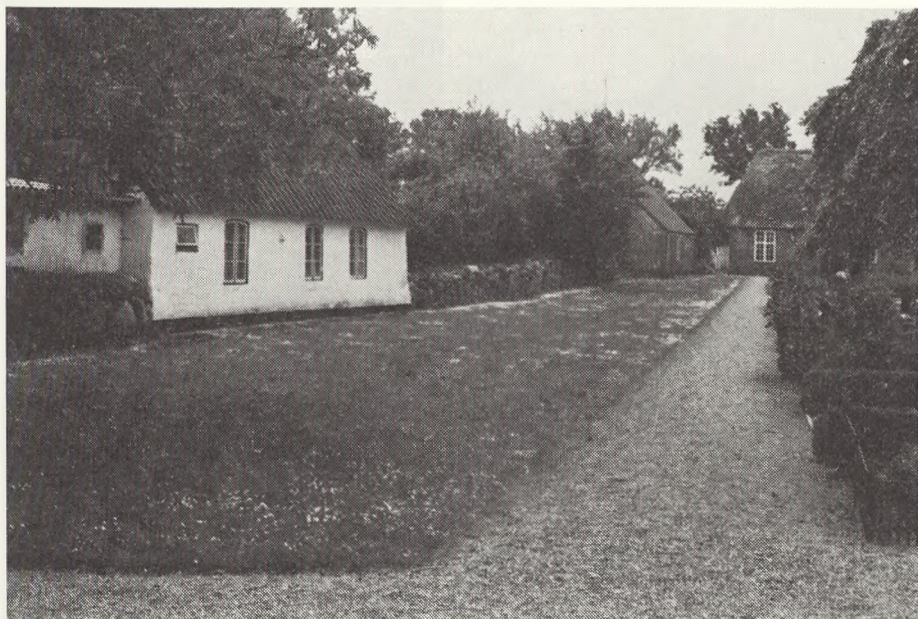
Ballum kirkegård.