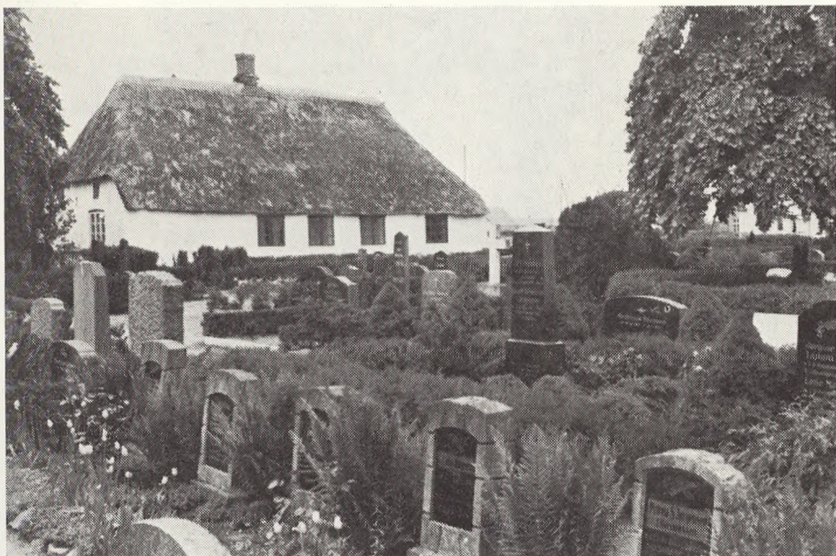
Ballum kirkegård.