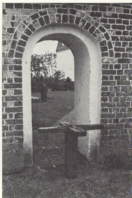
Sidedør med rist.