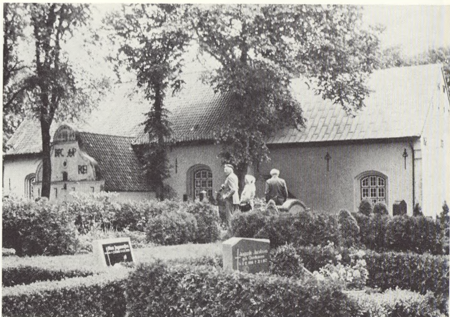
Fra den tyske side.