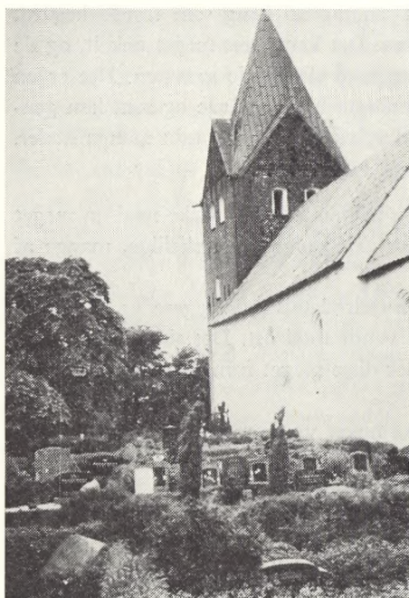
Ballum kirke og kirkegård.