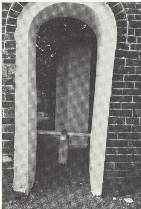
Sidedør med rist.