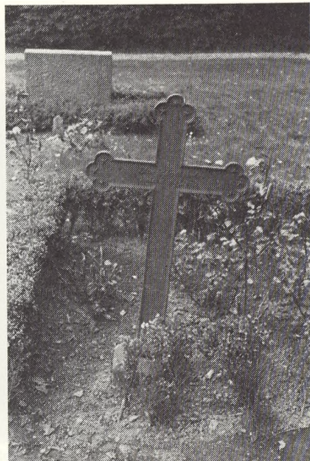
Ballum kirkegård, støbejernskors.