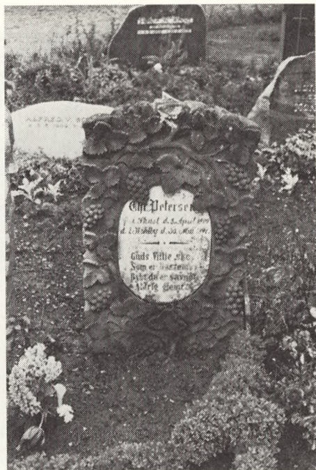
Nyt og gammelt mødes.