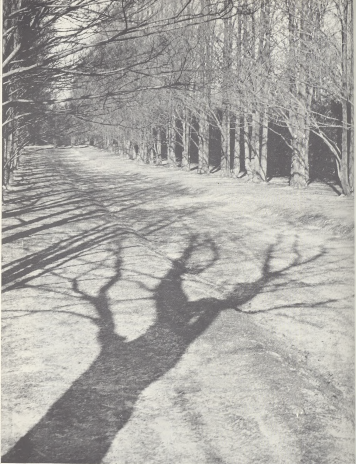
Mariebjerg kirkegård - Ulmus sarniensis .