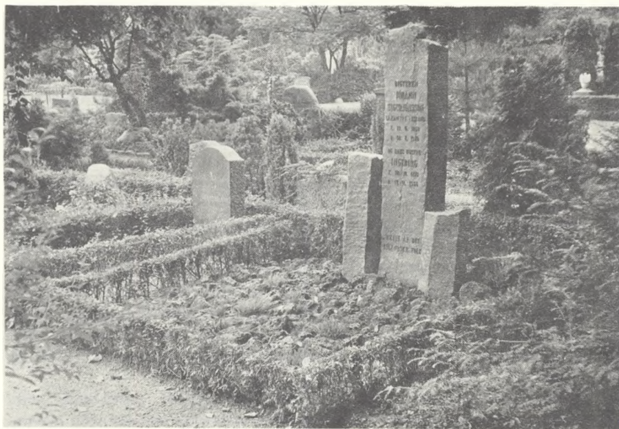
Individuelle hække. Vestre kirkegård.

Den er billig i indkøb, er ikke særligt krævende med hensyn til jordbundsforhold, men trives dog bedst i en frisk, næringsrig ikke for kalkholdig jord. Den er fuldt vinterfær, men vil dog om vinteren, særlig i tørre perioder, antage en kedelig vissengrøn, brunlig kulør, men egentlige vinterskader og svidninger vil ikke forekomme. Brede hække vil dårligt kunne tåle snetryk, derfor bør man ved klipping tilstræbe en stivhed i hækken, der dog kan gå noget ud over udseendet. Ved hård og årlig klipping vil den efterhånden blive tynd og tør, idet den kun meget dårligt bryder på gammelt træ, tåler således ikke en hård tilbageskæring, og er planterne først gået i stå og blevet bare for neden, er der som regel ikke andre muligheder, end at rydde dem. Ældre hække kan dog få et frodigere udseende ved at man undlader årlig klipping og f.eks. nøjes med klipping hvert andet år. Thujahække tåler kun dårligt skygge og må absolut ikke stå under store træer hvor næringsforholdene er ringe, her må vælges andre planter. Thujaen er velegnet til maskinklipning med alle gængse el-klippere og en stor arbejdsbespa-