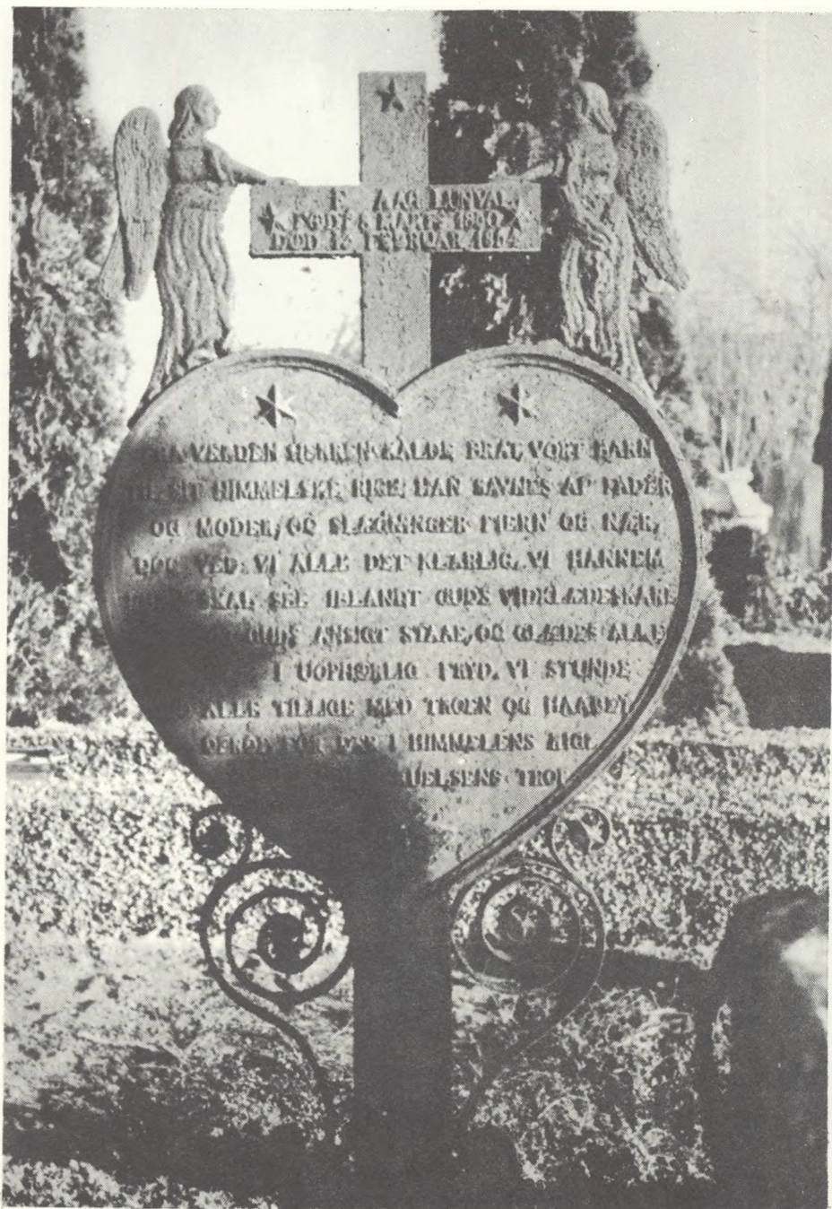
Gravmindet med den usædvanlig lange tekst er sat over en kun fire årig dreng. Fra Torup sogn i Frederiksborg amt. 1854.