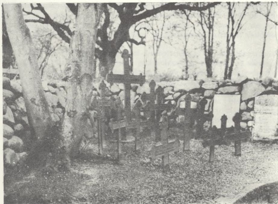
Kunne man blot stille gravkorsene fra sløjfede grave i lapidarium som her, ville meget være vundet og dermed bevaret. Foto fra 1972.

Salighedshåbet: Fra vor verden kalde brat vort barn til sit himmelske rige. Han savnes af fader og moder og slægtingen fjern og nær. Dog ved vi alle det klarlig,