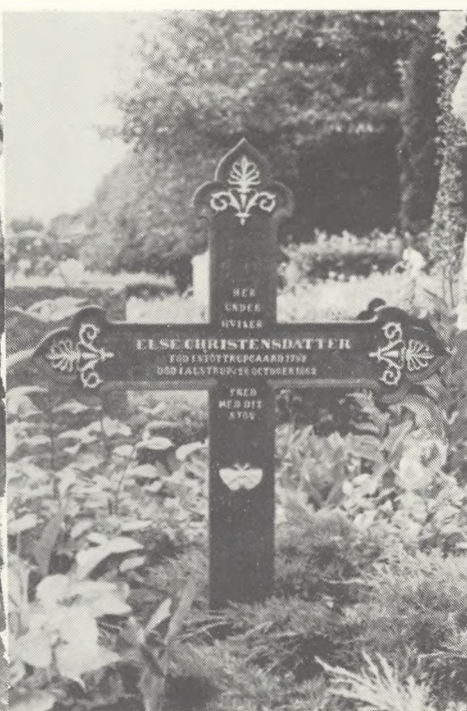
Et mere spidst kløverbladskors. Fra Alstrup sogn i Aalborg amt.

Gravmindernes udseende varierer meget. De har for det meste korsformen, men en del tynde støbte plader forekommer f.eks. også. Hvor det drejer sig om en kors, er det enten sat direkte ned i jorden, eller det hviler på en sokkel oftest af sten. Højde og bredde varierer meget, men gennemsnitshøjden er noget over en meter, og bredden ca. 2/3 af højden. Tykkelsen er nogle få cm.