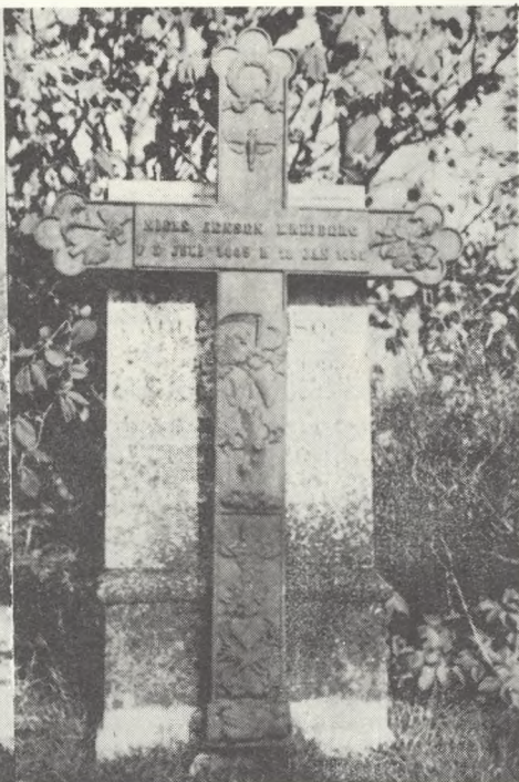
Korset har 8 forskellige slags mere eller mindre anvendte ornamentter og er helt enestående derved. Fra Resen sogn i Ringkøbing amt.

En af de ting, der kan udtrages af indskriftmaterialet, er de begravedes fordeling på socialgrupper, og her viser det sig, at det især er embedsmændene (præster først og fremmest) og landmændene (og her i langt overvejende grad gårdmændene), der fik et støbt gravminde på deres grav. En speciel og ret stor gruppe er krigergravene, som jeg dog ikke skal komme nærmere ind på nu udover at nævne, at de først og fremmest er fra 1848-50 samt 1864.