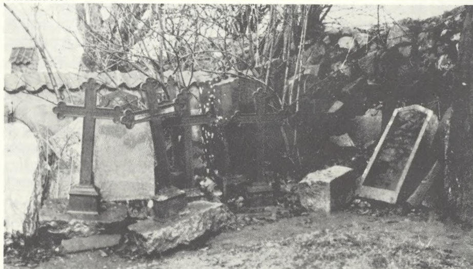
Mange af vore støbejernsminder ender på denne måde i en »skrammelbunde« inden de endeligt fjernes. Foto fra 1967.

Omkring 1800 sker der et vældigt opsving i denne tyske støbejernsproduktion, og også i Norge, der på det tidspunkt endnu hører sammen med Danmark, starter en stor produktion af støbejernsgravminder. Til Danmark er moden utvivlsomt kommet fra Tyskland og da over Hertugdømmerne, hvor det store støberi i Rendsburg, Carlshütte, blev grundlagt i 1827. Fra Carlshütte er bevaret en del ældre kataloger over produktionen, og mange af katalogernes korsformer har jeg genfundet i Sønderjylland, hvilket kan tolkes som dels import dels inspiration fra Carlshütte.