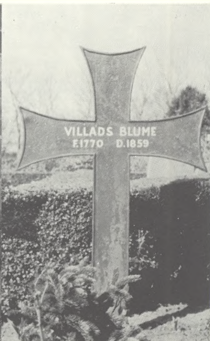
Her har det lidt spidse kløverbladskors en plade i korsarmenes skæring. Fra Halsted sogn på Lolland.