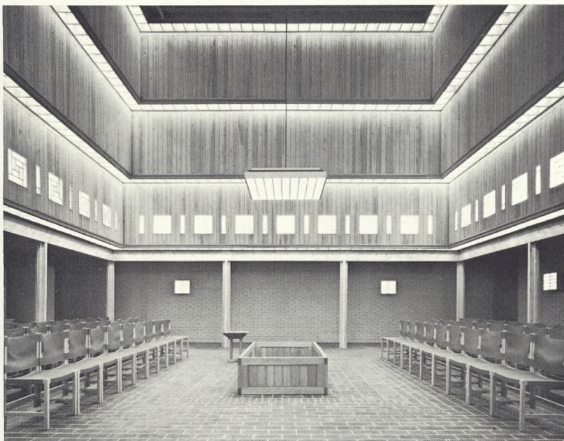
Fig. 10 Lille kapel.

Det store kapel rummer 306 siddepladser. Loft og overvægge er beklædt med træpaneler. Profiljernkonstruktionerne er synlige, væggene står i hvidmalet, blank mur, og gulvet er belagt med engelsk grågrøn skifer. Kapellets