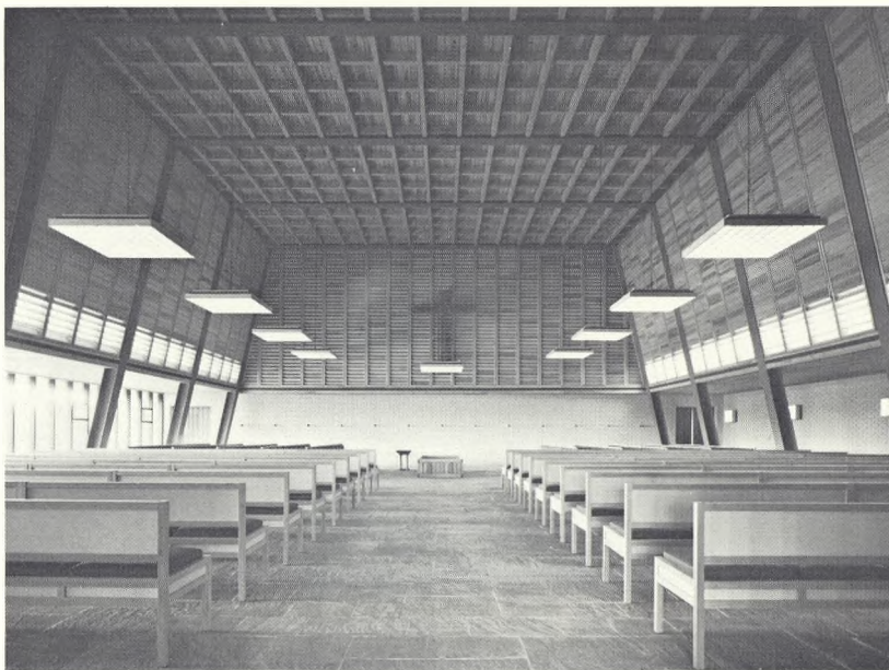
Fig. 11 Store kapel set fra indgangen.

østvendte side er en stor glasvæg, der bevirker en stærk fornemmelse af kontakt med naturen. Et kors er anbragt på kapellets bagvæg.