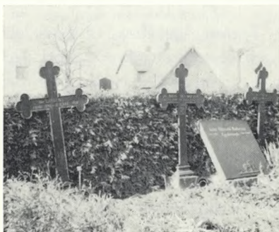
Fig. 3, th. Støbejernskors. Perioden 1870—1890. Eggerslevmagle kgd.