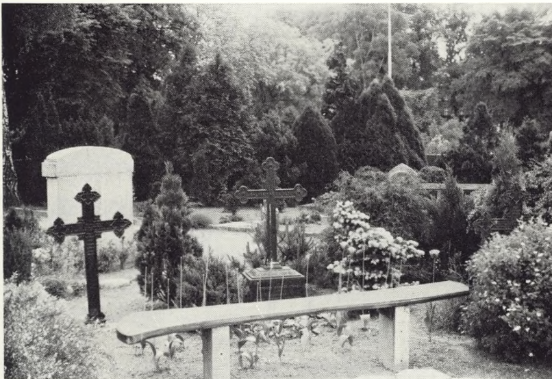
Fig. 66 Værdifulde jernkors opstillet i et helt fremmed miljø bag „dekorativ“ bæk.

På kortet fig. 67 ses en smal smøge på 7–15 meter mellem kirkemuren og fyrcælderbygningen. Denne smøge, der fungerer som en meget lidt benyttet bagindgang til kirkegården ligger meget smukt og samtidig centralt for kir-