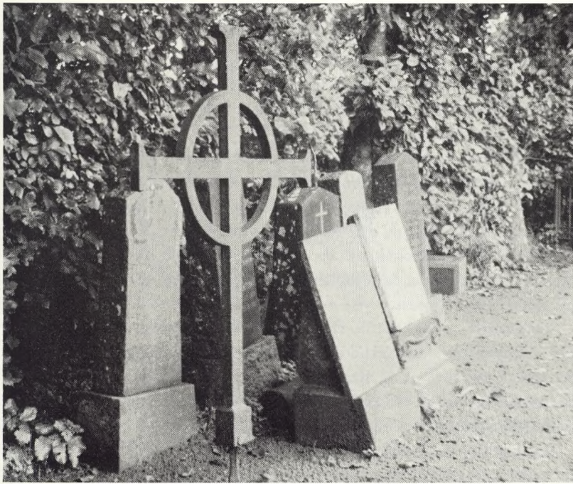
Fig. 65 En gruppe monumenter fra sløjfede grave tilfældigt, men smukt og rigtig opstillet.

jernkorsene sølvbronze eller cykellak og stille dem op mellem stenhøjsplanter og naturtræsbenke og sommerblomster.