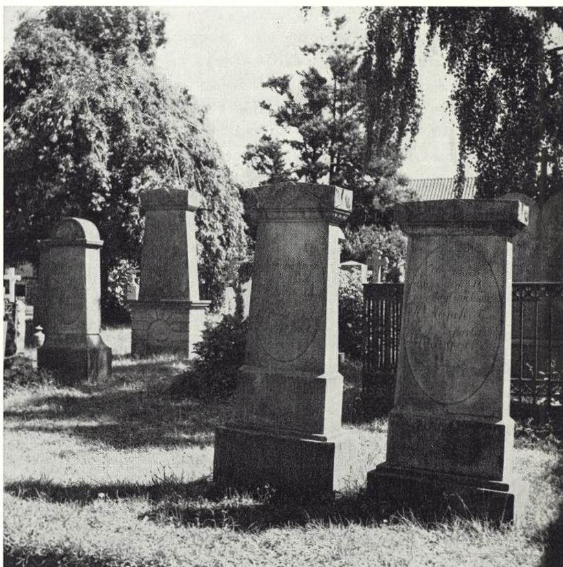
Fig. 29 Sandstensgravmæler på Nexø gamle kirkegård.

tur. Indskrifterne bliver lange og sentimentale. Thorvaldsens elever og efterfølgere, navnlig Freund og Jerichau skaber højt kultiverede monumenter i nyklassicismens formsprog, som de tilegnede sig ved direkte at studere og efterligne den attisk-græske gravstele. Under den hjemlige jernstøbnings store opsving o. 1850, blev i nygræsk og nygotisk stil fremstillet talrige gravmonumenter, især prisbillige gravkors, der skønt de i nogen grad bærer præg af at være seriefremstillede, som oftest er kønne.