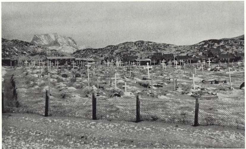
Fig. 33. Godthåbs store kirkegård.

Også denne kirkegård benyttes ikke mere til nye jordfæstelser. En fjerde er anlagt for få år siden i den dal, hvor næstældste ligger, men længere inde og for enden af en sø. Ved sit ret dybe gruslag afgiver denne kirkegård de hidtil bedste betingelser for sit øjemed, men selv her lægges nogle sten henover gravene, hver med sit trækors. Om somrene udgraves nogle grave med henblik på eventuelle dødsfald ved vintertide, hvor den grønlandske permo-frost da umuliggør spadestik i jordmonnet.