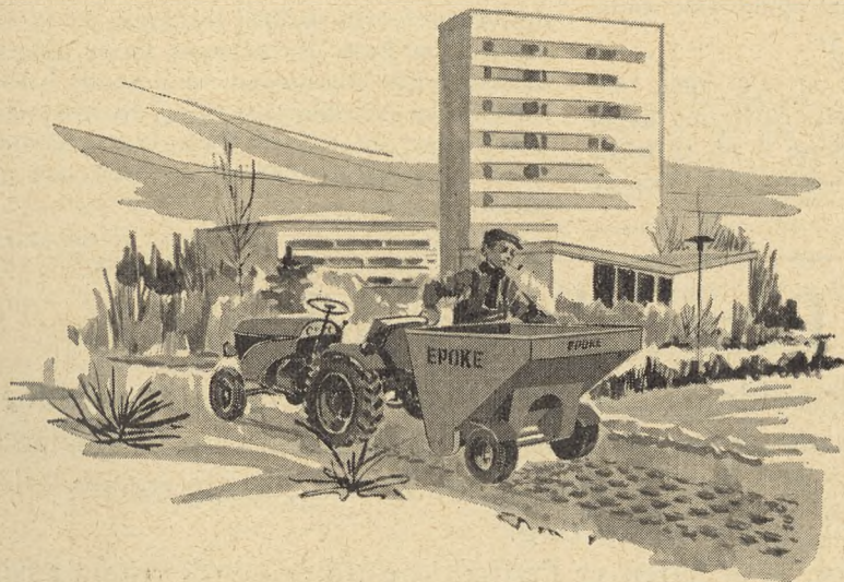
Grusspreder, model SK 8

Der forbeholdes de nuværende beboere i indlemmelsesområdet ret til begravningsplads