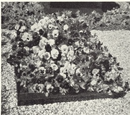
19. Gravbed med stedmoderblomster.