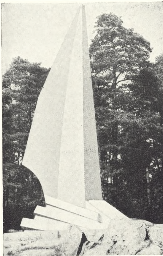
77. Gravmæle af Tore Strindberg for de omkomne ved André-expedi- tionen. Stockholms Norra.

gård og har mange smukke, landskabelige partier. Beskrivelsen af Uppsalas kirkegård gælder også for denne med hensyn til tuer på ældre del og flade grave på den nyere del fra de sidste 20 år. Dog ses her en hel del mere blomsterbeplantning og megen anvendelse af forskellige prydbuske, ligesom mange grave er store og pompøse med kunstneriske monumenter, da mange af Sveriges (Stockholms) kendte personer ligger begravet her. De mange blomsterplanter skyldes bl. a., at kirkegården har et stort, men gammeldags blomstergartneri og en planteskole, hvor man fremstiller planterne både til sig selv og Stockholms andre kirkegårde.