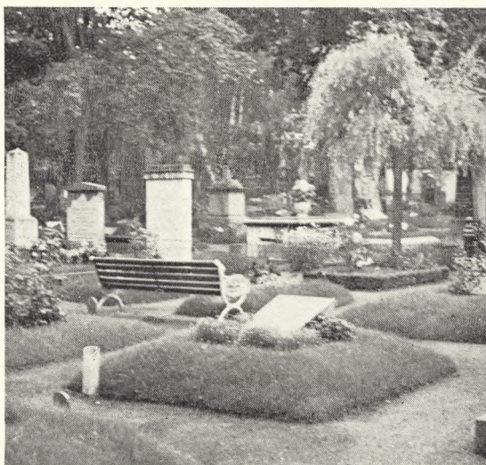
76. Gravtuer på Stockholmstrakten.

Norra begravningsplats blev indviet 1827 og dækker 45 ha. Terrænet er meget afvekslende med småklipper, bakker, dale og sletter og her fandtes fra starten en masse fyrretræer og enebærbuske, der er bevaret, foruden at der siden er plantet mange birketræer, så også denne plads kunne med rette kaldes for en skovkirke-