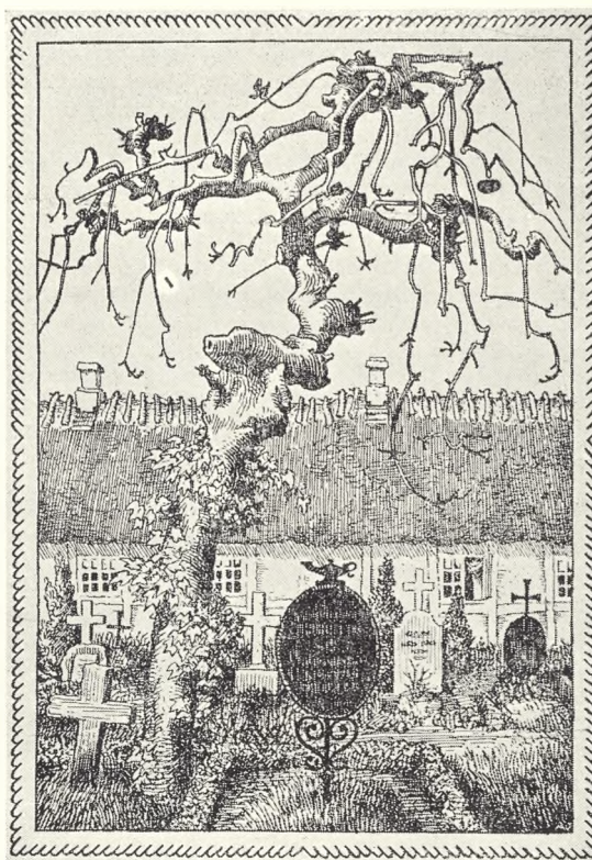
38. Gammelt motiv fra sjællandsk kirkegård med hængeask, kors, smedejernsgravmæler m. m.

Når man besøger provstiets kirkegårde, er der to parter, man efter synsforretningerne med taknemlighed tænker til-