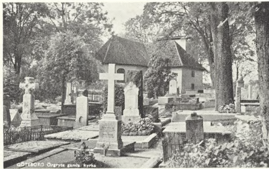
39. Örgryte (Göteborg) med tumbaer, bestemt af terrænet.

Tumbaen, den stensatte rektangulære grav, er ofte gengivet i malerier mv. som den grav, hvori Kristus blev lagt, uanset at evangelierne strengt taget siger noget andet (klippegraven); man må dog ikke deraf slutte, at det i Norden var en gængs form for grave; den kunstneriske frihed kan her komme til at spille beskueren et puds, og der kan højst være tale om, at tumbaen har været anvendt overfor fornemme; en varieret type med trapezformede sider er bl. a. kendt fra klosterbegravelser.