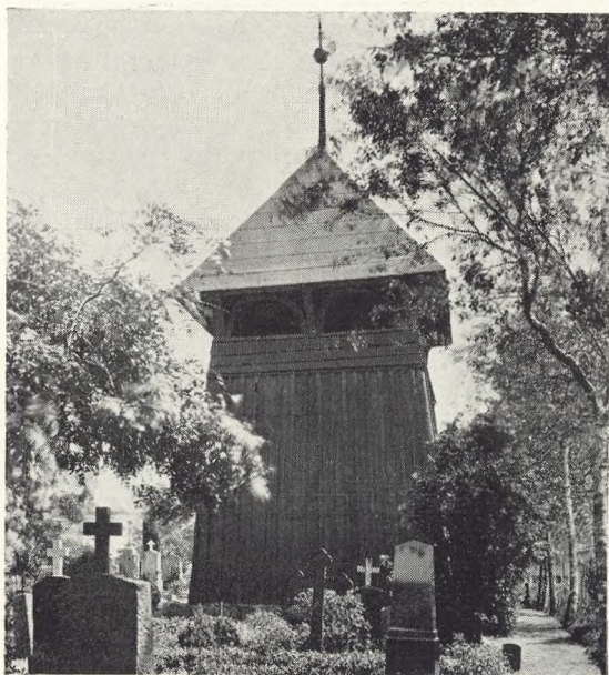
3. Holbøl, Sønderjylland.