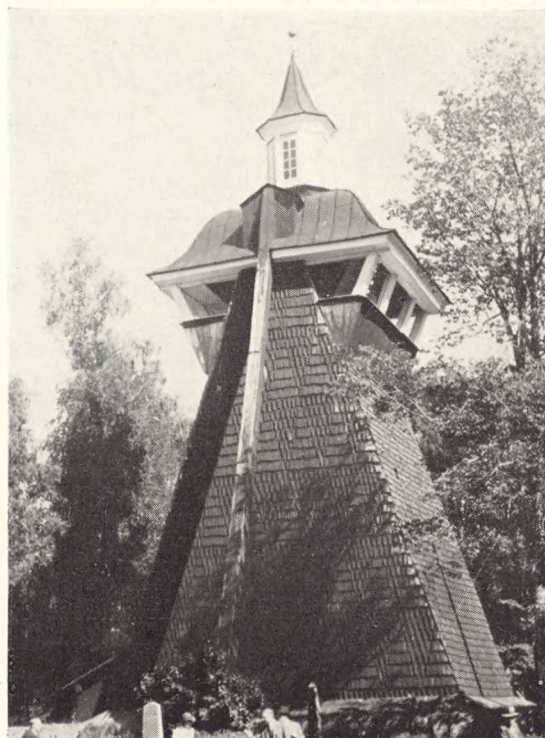
7. Leksand, Sverige.