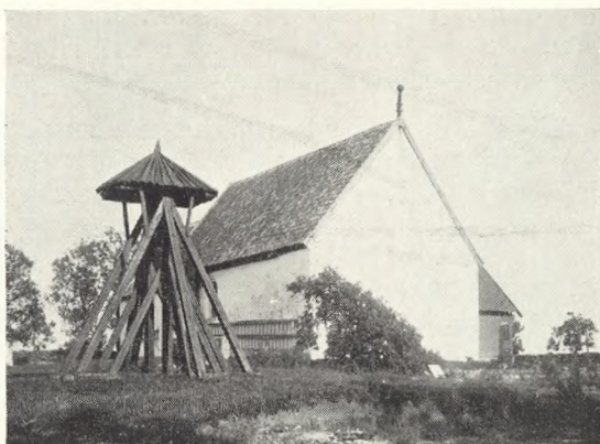
5. Hjørthede, Viborg amt.

På Bornholm og i landets sydlige egne (dvs. Sønderjylland, Sydfyn med tilhørende øer og Lolland-Falster) har de åbne klokkestabler derimod næppe været alt for almindelige, thi her har de lukkede klokkehus gamle hævd. De bornholmske er alle opført af mur og bindingsværk og skiller sig herved ud fra de øvrige, som er helt af træ. På Bornholm, hvor næsten hver eneste kirke har haft et fritstående klokkehus, er der bevaret otte. Den omstændighed, at flere af kirkerne, f. eks. S. Ib og Åkirke, fra begyndelsen var blevet forsynet med et muret vesttårn, hindrede ikke opførelsen af et særligt klokkehus. Klokkehuset ved S. Povls kirke står i den østre kirkegårdsmur, og