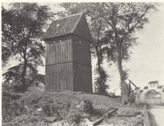
6. Birket, Låland.