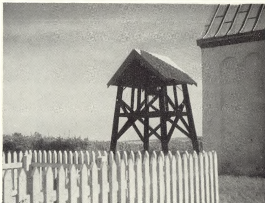
1. Mårup, Ålborg stift.

Klangen af kirkeklokker har en egen, næsten magisk virkning på mennesker, og således har det været gennem århundreder. Missionærerne, som forkyndte den kristne tro blandt hedninge, bragte foruden bøger også klokker, fortrinlige propagandamidler og dømonskræmsler, som siden har været i kirkens tjeneste. Snart føles klangen lys, snart dyster, alt efter som den kalder til gudstjeneste eller begravelse. Mellem 11—12 om formiddagen er den i visse egne af landet altid vemodig, thi da bringer den kun bud om, at døden har gæstet sognet i nattens løb. Siden Harald Blåtands tid har klokkerne