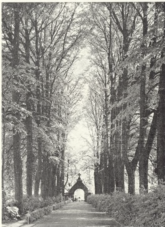
10. Lindeallé, Gråbrødre