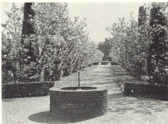
8. Magnolea-allé, Østre.

Gråbrødre Kirkegård , der er 2.3 ha stor, domineres af en prægtig gammel lindeallé og en samling fornemme stor-træer,