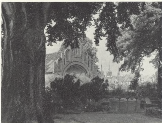
12. Kapel på Gråbrødre, i forgrunden komponisten C. E. F. Weyses grav.