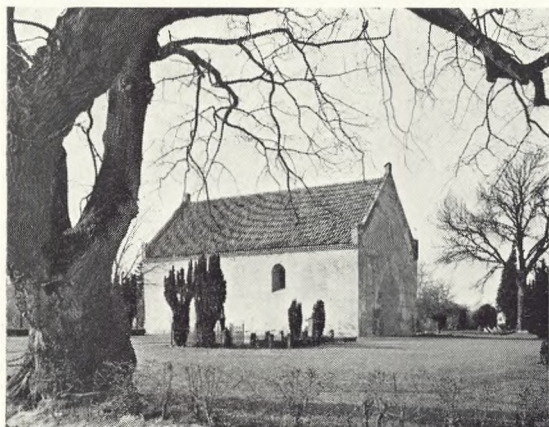
13. Sct. Ibs kirke og kirkegård.