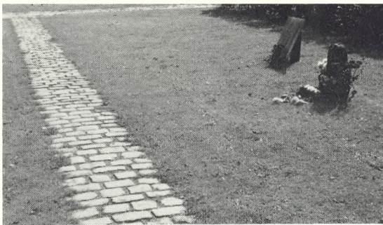
116. Brolagte bæregange.

vejleder og planlægge ud fra de forudsætninger, som tidens stadige foranderlighed må give anledning til.