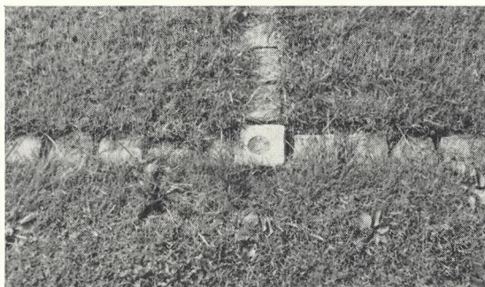
117. Indstøbt nummerskilt.

Hele arealet, hvor der kun er bevaret enkelte store, smukke bøgetræer, er udlagt med græs. En ringvej til tung kørsel blev belagt med grov asfaltbelægning, og man undgik høje kantsten og afsluttede vejbelægningen med en række ankasten ind mod græskanten. Herved spares lugning og opretning af nedkørte kantsten, og græsklipperen kan frit klippe helt ud