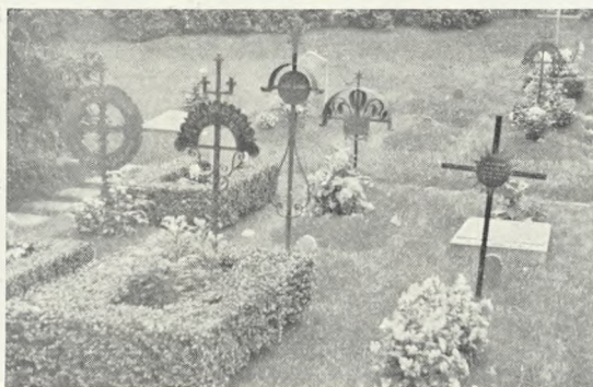
129. Smedejern. Stockholm. Se teksten s. 92.

Klebersteinen er et utmerket byggemateriale, som allerede middelalderens kirkebyggere forstod å utnytte, f. eks. i Nidaros domkirke. Både Vågå, Sel og Kvam har klebersteinsbrudd, og det lå nær for Gudbrandsdalens kunsthåndverkere å nytte dette stedeagne materiale til gravminner. Bergarten er ildfast og sterk mot