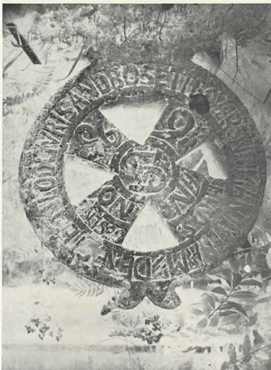
128. Sandbustenen i Vågå. Hjulkors i klebersten.

og staffert, fikk de etterhvert tidens patina av vind og vær.