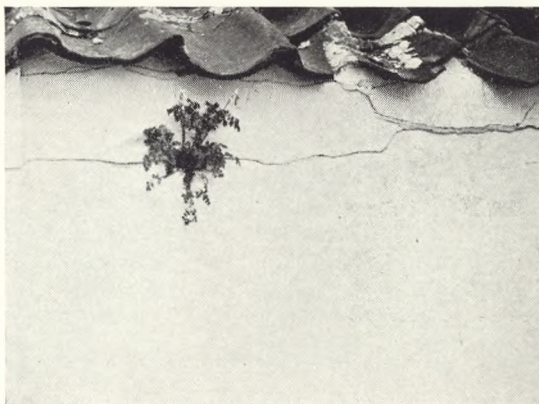
16. Corydalis lutea i mursprække. Jorløse, Sjælland.

Der er altid noget tillokkende og tiltalende ved at se en plante opføre sig anderledes end de fleste af slagsen og derved udvise en selvstændighed overfor den mere veldisciplinerede masse. Lad være at frøforædlere og planteskolefolk ikke kan lide det, fordi sådanne planter træder udenfor både nummer og geled og fordi de manifesterer en art trods imod arvelighedsbegreber og plantetiltrækkernes beregninger. Men den bøg i hækken, der kommer med bladene før de andre, eller den lind i alleen, der har større blade end de øvrige, — ja og så den kongelys, som planter sig selv demonstrativt i en fuge i en havetrappe, —