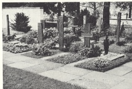
122—24. Motiver fra Bundesgartenchau i Stuttgart 1961.