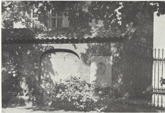
19. St. Petri kapel. Muren imod Nørregade.

Siden er Urtegården, som svarer til en almindelig kirkegård, blevet betydeligt indskrænket, bl. a. ved udvidelser af telefonhuset i Nørregade, og er nu kun ca. 700 m 2 , men endnu er det dog en henrivende, fredfyldt plet midt i byens hjerte. I det halvville græs ligger store, forvitre-