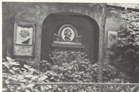
22. Biskop Münsters familiebegravelse.