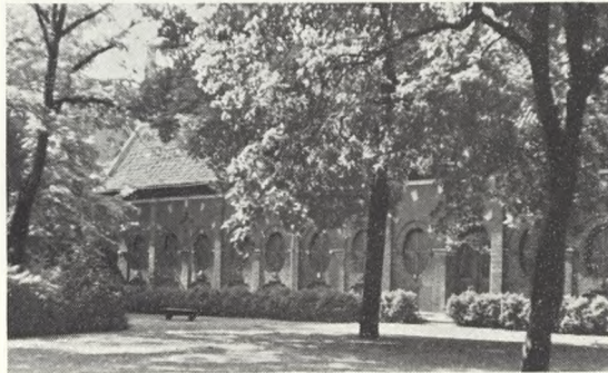
20. Hovedkapellet set udefra.