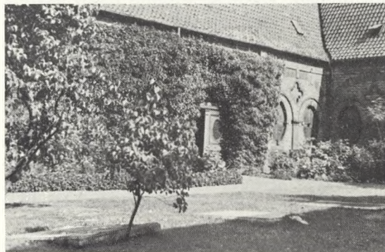
21. Urtegården og midterlojen.