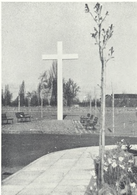
48. Kors i hvid cement på Nakskov Annexkirkegård.