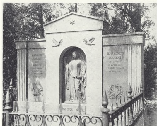
52. Gravmæle for J. A. Jerichau og hustru, Solbjerg Kirkegård, Frederiksberg.