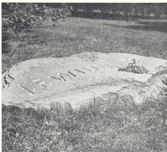
50. Gravmæle for J. F. Willumsen i Frederikssund (jevnf. teksten s. 45).

Med samme kraft og styrke som navnet Bissen lyser navnet J. A. Jerichau (1816—83), og f. ex. i Glyptoteket står hans