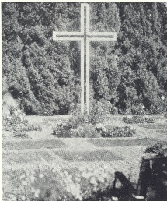
49. Kors i hvidmalede jernrør på Sct. Jørgensbjerg Kirkegård, Roskilde.