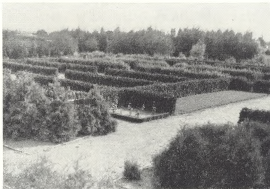
15. Parti fra Sønderborg kirkegård i Nystaden.

Omkring år 500 har vi (hos Dionysios Areopagita ) følgende skildring af en kristen begravelse: »Den afdødes slægtninge priser ham lykkelig, at han nu har nået det eftertragtede mål og synger takkesange til ham, som har forundt den afdøde sejren, og ønsker sig selv det samme. Man bærer det døde legeme til biskoppen, som med glæde tager imod det. Når han har samlet præsterne, bliver den døde bragt hen i helligdommen... Biskoppen holder bøn og taksigelse, diakonerne læser af den hellige skrift om løfterne om de dødes opstandelse og synger passende salmer. Derefter beder biskoppen over den døde, salver legemet med olie og fremsiger den almindelige forbøn. Derefter følger begravelsen«.