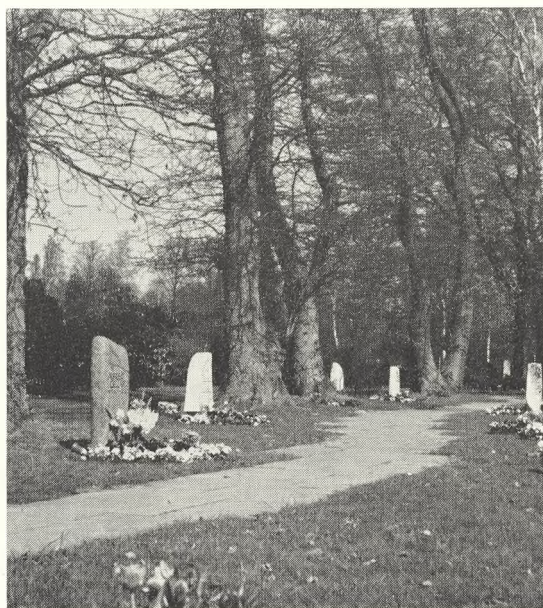
18. Hauptfriedhof Ohlsdorf. Begravelser i græs mellem parktræer.

Legemet i kisten, navnet i stenen, begge dele vidner om, at her anser man ikke døden for den totale udslettelse. Lad spørgsmålet være frit, men lad der i hvert fald aldrig blive tale om en tvang til brænding.