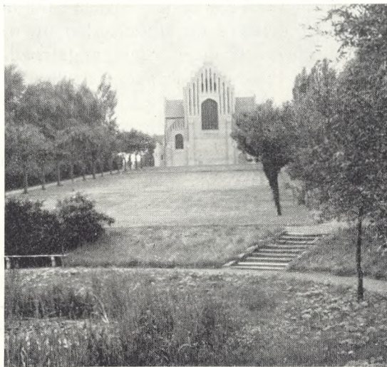
16. Christianskirken og Sønderborg kirkegård i Nystaden.

Der er ikke her grund til at gå ind på den følgende udvikling i middelalderen ,