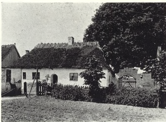
103. Kirkelade og kirkegårdsport, Vigersted, Ringsted herred 1909.