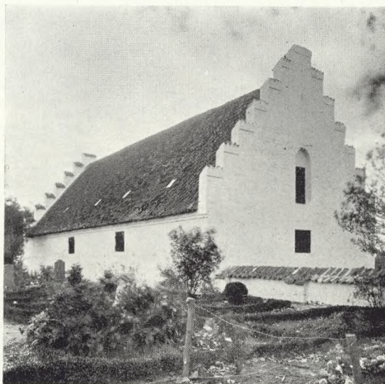
105. Kirkelade, Tranebjerg, Samsø 1915.