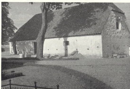
102. Kirkelade i Store Rise, Ærø. Foto: J. Th. 1957.

Rundt om kirkegården plantes en række lind som en fortsættelse af rammen om den gamle kirkegård.