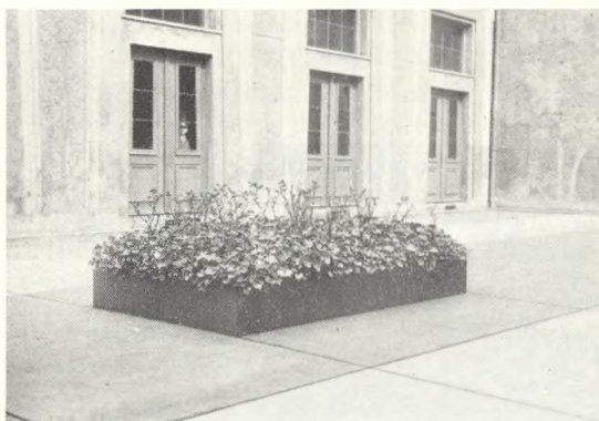
42. Thorvaldsens grav.