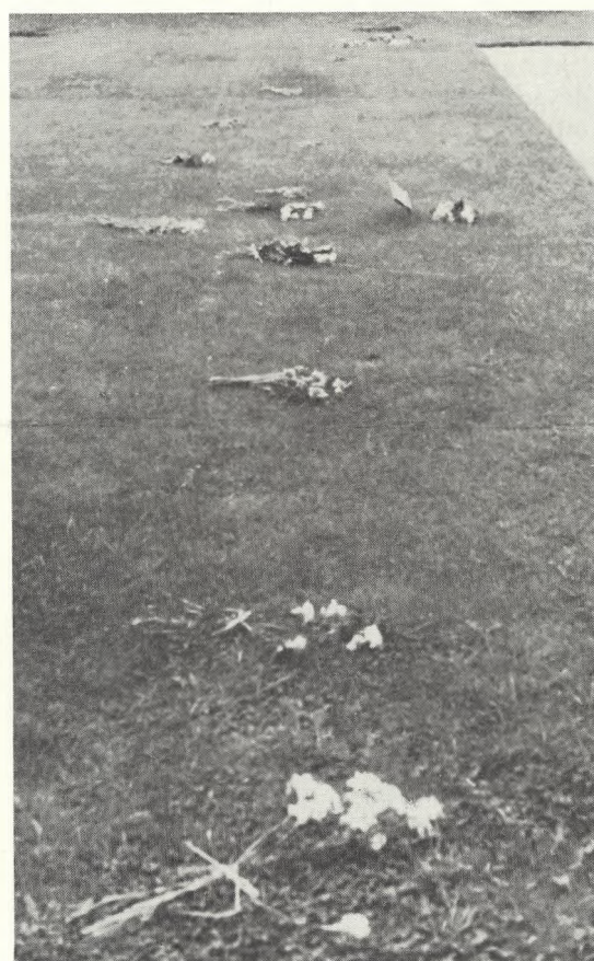
39. De efterladte lægger blomster, hvor de tror den afdøde nedsat.