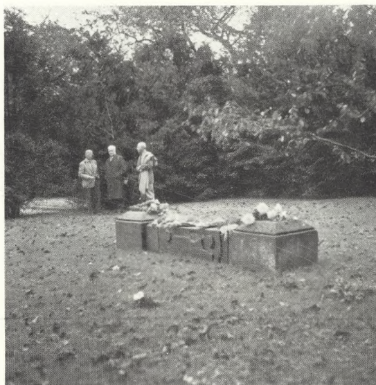
38. Fællesgraven Mariebjerg Kirkegård.

Fællesgraven deles ved hjælp af pløkke, usynlige for publikum, op i rækker på f. ex. 0,5 m's bredde, og på kirkegårdens kort over samme er rækkerne delt i felter på 0,5×1 m med fortløbende numre, og i protokollen indføres hvilke asker der ligger i hvert nummer, og naturligvis hvornår de er nedsatte. Fredningstiden er ti år ligesom for almindelige urnenedsættelser i familieurnegravsteder, og der er juridisk ikke noget i vejen for, at man ti år senere kunne begynde forfra med nedsættelser i anden omgang på samme