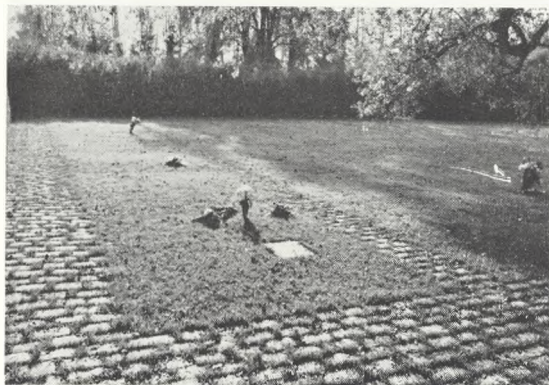
41. Fælleskistegrav Københavns Vestre Kirkegård.

Gennem årene er det jo flere tusinde, der er kommet til at hvile i fællesgraven, men at de ikke alle er glemte, vidner det