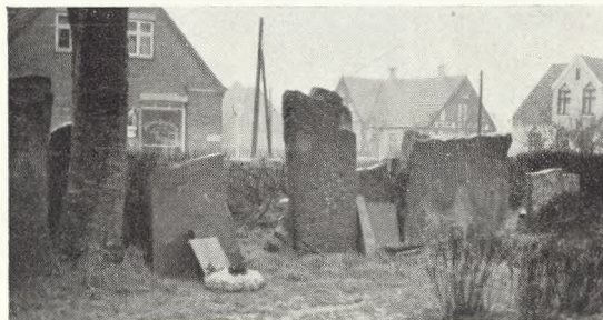
119. Fire runesten og (længst th.) en senmiddelalderlig gravsten på Vestermarie kirkegård, Bornholm.

de indskrifter fra den ældre runerække, og den på fig. 120 avbildede runesten, der nu står indenfor Oddernes kirkegårds