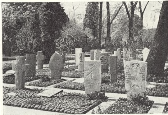
118. Stenmaterialer af mange slags i brug på særudstillingen »Friedhof und Grabmal«, Stuttgart 1961.

Selv om adskillelsen af de enkelte gravrækker med hække eller anden beplantning er udeladt (eller måske netop derfor) er helhedsvirkningen god. Men, og der er et stort men, man må ikke glemme at alle gravmælerne er udvalgte og hvert enkelt er et personligt udformet hele. Omset til den virkelige kirkegård ville man sikkert aldrig kunne få et så stort kunst-