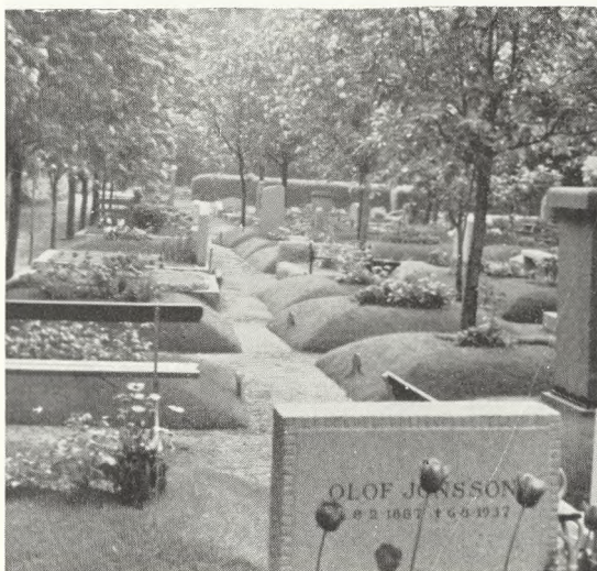
60. Gravtuen er kultiveret og almindelig anvendt. Stockholms-traktaten.

Kirkegården er gennem tiderne fra kun at være et fredet hvilested for de døde også blevet et sted, hvor mange forskel-