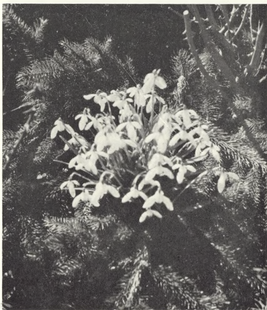
Fig. 5. Vintergækkerne er bøvet gennem gravstedets grandække.