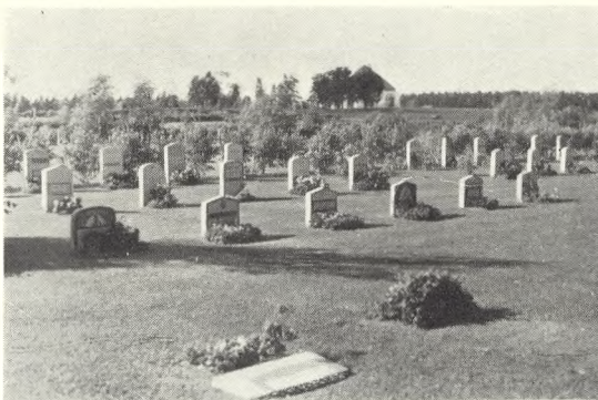
Fig. 4. Grave og gange i græs. Karlskoga kirkegård, Sverige. Foto: J. Th. 1949.

Det er en fornem opgave, vi i menighedsrådene har fået betroet med hensyn til vedligeholdelsen af vore kirker og kirkegårde. Måtte de drøftelser, de forestående kirke- og kirkegårdssyn kan give anledning til, styrke os i fælles glæde over denne opgave. —