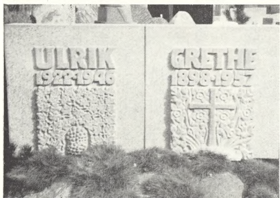
Fig. 128. Torvald Westergaard: Dobbeltmindesmærke (jevnf. VK 17 fig. 240).

Jeg vil ogsaa gerne lægge et ord ind for inskriptionerne paa gravminder — at de foruden navn og datoer ogsaa kan tale ved det, der staar paa dem derudover.