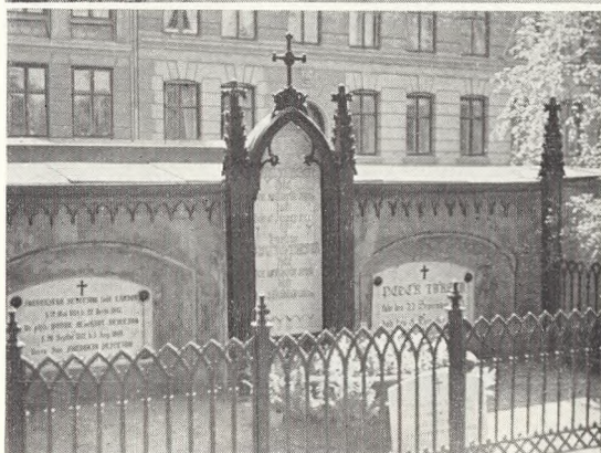
Fig. 130. Gravmæler og hegnsmur ved Assistens kirkegård.