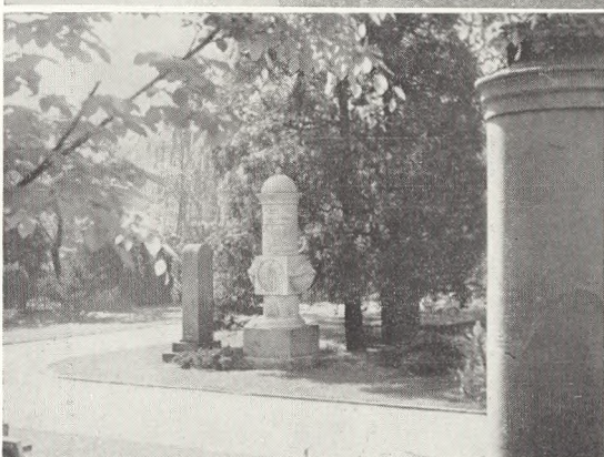
Fig. 131-32. Regulerede dele af afd. A på Assistens kirkegård.