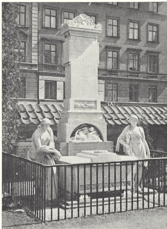
Fig. 133-34. Gravmæler på Assistens kirkegård. Øverst afd. A. 1026/27 af Johs. Wiedevelt (1794) og nederst A 956 (1802).