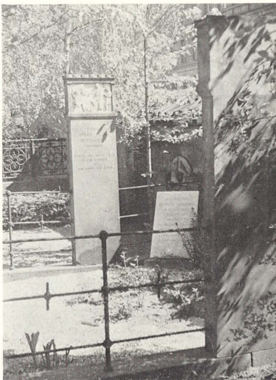
Fig. 135-36. Gravmæler på Assistens kirkegård. Øverst A 109 af Bissen og Bindsbøll, nederst A 990/91.

Dette arbejde er allerede begyndt, idet man når passende store stykker hjemfalder sløjfer de mindre gange, sår græs eller planter busketter. Allerede nu er kirkegården et yndet opholdssted for mange mennesker, og sommeren igennem er kirkegårdens bænke optaget af ældre mennesker, som her finder et smukt og roligt sted, selv om gadens larm høres, og der er ingen tvivl om, at kirkegården også som park vil blive et uvurderligt gode for det tætbefolkede Nørrebro.