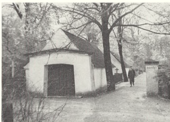
Fig. 129. Det gamle kapel på Assistens kirkegård.

Kirkegården blev snart for lille, og i 1804 kom den første udvidelse , det såkaldte interimsstykke. I 1804—05 byggede man muren om den næste store udvidelse, som strakte sig ud til runddelen og blev