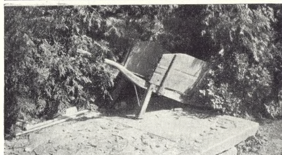
Fig. 94. Både den smukke gravliggersten og trillebøren kunne fortjene en mere værdig placering.

Det hører ikke til sjældenhederne at træffe toiletbygninger med en lige så uheldig placering, som fig. 93 viser, men det hører heldigvis til sjældenhederne, at der end ikke er tilstræbt en skærmende plantning.