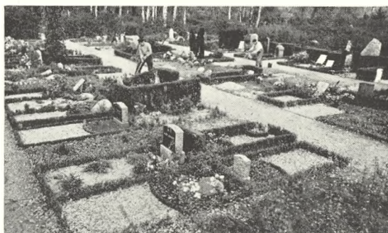
Fig. 110. Den almindelige type på liniegravsteder.