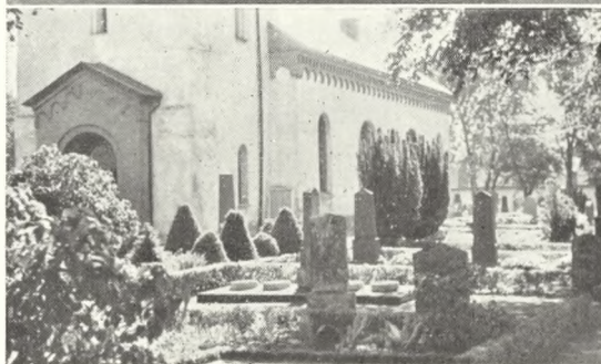
Fig. 113. Kirkegårdsparti med gårdgrave på skånsk kirkegård.