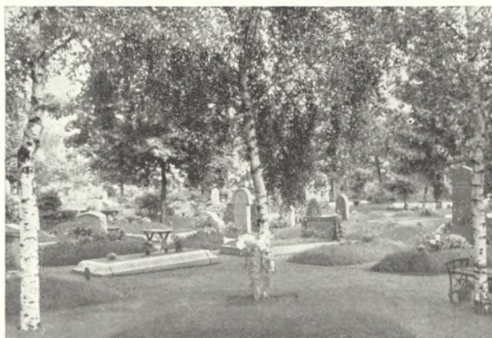
Fig. 112. Kirkegårdsparti med gravkuller på stockholmstrakten.

I de gamla svenska landskapen har i alla tider, som regel, graven varit familjens , då däremot i de sydsvenska landskapen, liksom i Danmark, gravplatsen varit bunden till gården och betecknande nog även kallats för » gårdagravplats «. I vissa församlingar, i mellan- och norra Sverige, kan man dock finna avgränsade platser på kyrkogården som utgjort eller utgör gemensam plats för ett byalag . Man kan således tala om att kyrkogården varit uppdelad efter socknens byar. Båda dessa former av gravplatser äro dock numera ej vanliga utan man talar i stort sett endast om familjegravar och ensamgravar (linjegravar). Ännu förekommer