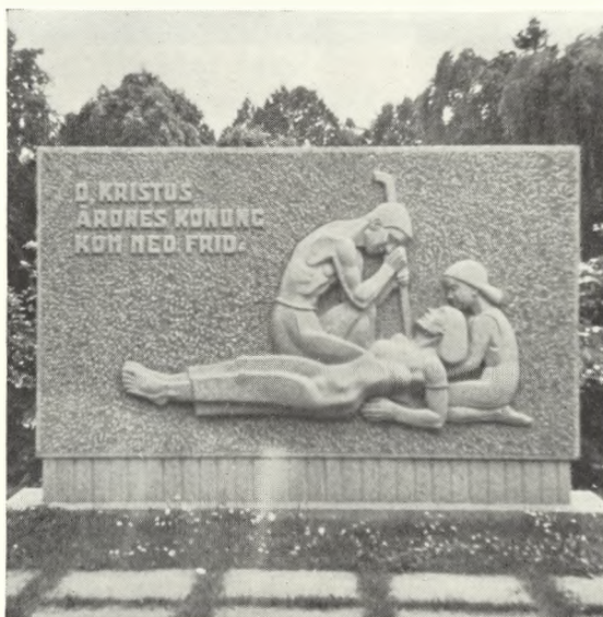
Fig. 37. Jonas Fröding: Monument i mindelunden på Lunds Norra. Jevnf. fig. 36 og 38.

Minneslunden utgöres av en rektangulär gräsmatta omgiven av bokhäckar. En gång av kalkstensplattor följer häckarna