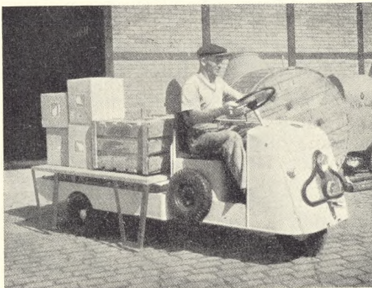
Fig. 27. Hirst. Industritruck.

kumme, hvor gravstenene vender indskriften udad, idet alle 4 hjørner er dannet af fragmenter af fine gamle bremersten o. l. Vi fandt disse, da Skærbæk kirkegård blev udvidet, og vi syntes, de var for pæne til at gå til, ligesom der intet af betydning kunne indvindes imod, at de (enten plattyske eller andre) indskrifter, der var hugget så sirligt og fint, meldte sig med deres brudstykkevise tale til beskuere og brugere af vandkummen. Også til den øvrige del af kummen fandt vi sokkelsten og kantsten etc. i ædle materialer, så kun selve avdækningen måtte fremskaffes (fra Bornholm). Arbejdet udførtes med megen forståelse af kampstensmurer, entreprenør M. Nielsen i Skanderborg.